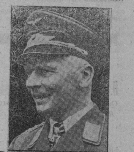
FIGURAS DE ACTUALIDAD

Berlín, 26.—Incluyendo los 17 barcos hundidos de que se da cuenta en el parte extraordinario de hoy, el número de unidades navales echadas a pique en los días transcurridos del mes de Febrero se eleva a 80, con un total de 534.300 toneladas. El mes anterior se hundieron 525.000 toneladas. Por tanto, a los veintiséis días del mes de Febrero se ha superado la cifra de hundimientos del mes anterior.—Efe.