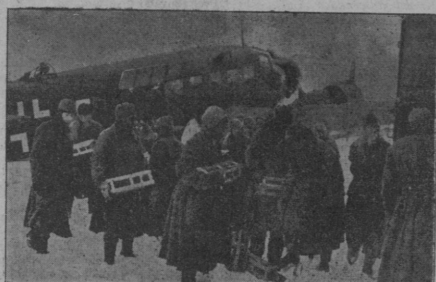
Los grandes aviones de transporte alemanes son muy útiles para abastecer las posiciones avanzadas de Rusia. He aquí la carga de dos de ellos

En el sector medio del Donetz los soviets han perdido nueve tanques, mientras que formaciones de vanguardia alemanas han cercado un grupo bolchevique. En otros varios puntos del Donetz han sido cercados grupos de soldados bolcheviques, a cuya exterminación se procede. En