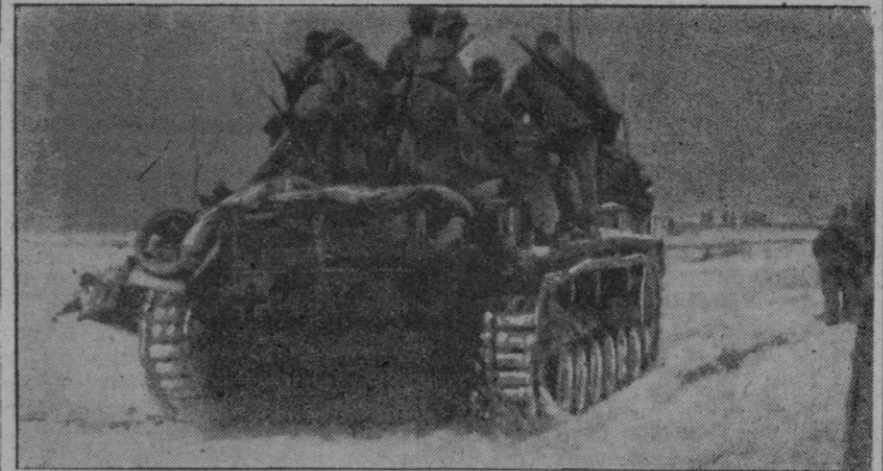
Granaderos de tanques marchan sobre los vehículos blindados a las líneas de com bate.

Rotura del frente bolchevique en el curso medio del Donetz