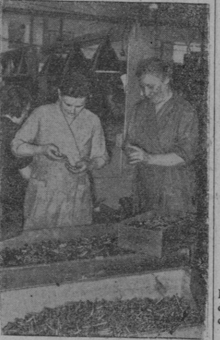
Mujeres alemanas trabajando en una fábrica de municiones