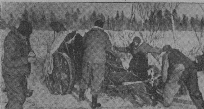
Cañón pesado de infantería alemana, emplazado en un sector del lago Ilmen

Cuartel general del Führer, 11 (5 tarde).—El alto mando de las fuerzas armadas alemanas comunica: En el curso de rudos combates, que continúan librándose en el sector meridional del frente del Este, han sido obtenidos considerables éxitos defensivos en varios puntos. Los bolcheviques han experimentado elevadas pérdidas en hombres y material. En el Cáucaso occidental se registran combates de importancia local. Nuestros contraataques han obtenido éxitos sobre las fuerzas enemigas nuevamente desembarcadas al Suroeste de Novorossisk. En el Donetz superior han sido rechazados los ataques enemigos con sangrientas pérdidas para los soviets. Ha sido estrechado el cerco en torno a un contingente de fuerzas soviéticas. Al Este del sector de Oskol, los bolcheviques han intentado, mediante ataques en masa, aislar a las fuerzas alemanas de determinados sectores y obstaculizar así la continuación de los movimientos combativos. Sin embargo, los contraataques de nuestras reservas locales han logrado derrotar y aniquilar a las fuerzas enemigas. Cuarenta tanques enemigos han quedado sobre el campo de batalla. Las fuerzas aéreas han realizado repetidos ataques contra las columnas enemigas en marcha y las concentraciones de tropas y vehículos. En el sector septentrional, en vista de la imposibilidad de progresar al Sur del lago Ladoga, el enemigo ha trasladado sus ataques a otros puntos, pero han fracasado, a pesar de