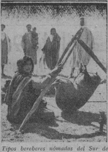
Tipos bereberes nómadas del Sur de Túnez

Roma, 11 (5 t.).—Comunicado del alto mando de las fuerzas armadas italianas: «Ningún acontecimiento de importancia en el frente tunecino. La aviación alemana derribó cuatro cazas británicos en combates aéreos. Las víctimas de la población árabe de Kairuan, por la incursión aérea enemiga.»—Efe.