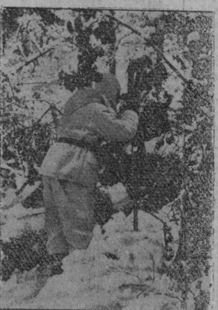
Un observador alemán camuflado con el yamaje, toma datos de las líneas enemigas con ayuda del telémetro de tijera

ejércitos del África del Norte francesa.