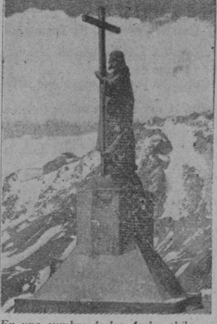
En una cumbre de los Andes chilenos, a 3.700 metros de altura, fué erigida esta imagen de Cristo, para lo cual se utilizó el bronce de un cañón, constituyendo aquélla un símbolo de la paz intangible entre las naciones de Chile y la Argentina. En el pedestal figura la siguiente inscripción: "Estas montañas se transformarán en ruinas antes que los pueblos de Chile y la Argentina rompan el juramento que los dos países han jurado mantener al pie de Cristo, nuestro Salvador".