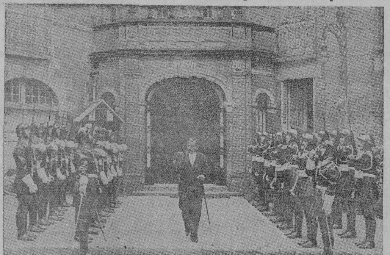
LAVAL HA SIDO DESIGNADO PRESUNTO SUCESOR DEL MARISCAL PETAIN.—En la fotografía aparece Laval saliendo de la residencia del jefe del Estado francés, en Vichy, después de celebrar una conferencia con Pétain

La Sección Femenina Igualmente la Sección Femenina conmemorará fervorosamente la fecha de mañana. Además de asistir a las solemnes honras fúnebres del templo catedralicio, todas las margaritas, flechas y flechas azules se reunirán a las seis de la tarde, y las restantes camaradas de la Sección Femenina, a las siete y media, para rezar el Santo Rosario en memoria de José Antonio.