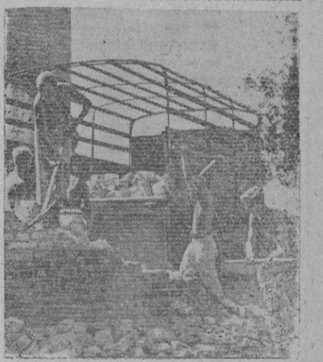
Muchachos del Servicio de Trabajo alemán dedicados en un sector, al Sur del frente del Este, a trabajos de construcción y reconstrucción. Aquí, por ejemplo, construyeron un aeródromo

Para el aguinaldo a los camaradas de la División Azul, entrega, segoviano, tu donativo cuantioso o modesto—y al medir esta cuantía medita sobre la inagotable generosidad de los voluntarios—en los establecimientos bancarios, con destino a la cuenta abierta a tal fin. Así cumplirás como buen español, como digno camarada de los que heroicamente luchan por ti en Rusia.