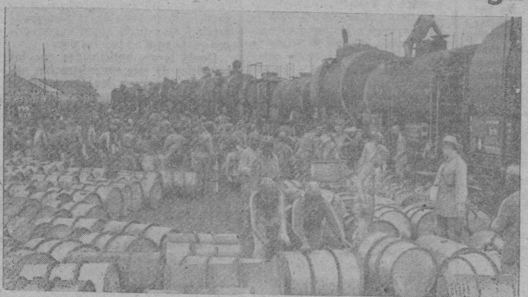
GASOLINA PARA EL FRENTE. —En una estación rusa ocupada por los alemanes, se procede a la descarga de un tren cisterna. En los bidones será transportada a las distintas unidades del sector

Brillantes golpes de mano Berlín, 19 (5 t.).—Después de una irrupción por sorpresa en las posiciones soviéticas del sector central del frente Este, los granaderos alemanes conquistaron el 17 de Noviembre trincheras bolcheviques de una longitud de 400 metros y destruyeron las posiciones fortificadas, aniquilando a sus defensores, según comunica el mando alemán. Los grupos de choque regresaron con numerosos prisioneros a sus propias posiciones, en cumplimiento de las órdenes recibidas. En otro punto del frente, las tropas de reconocimiento germanas han efectuado un golpe de mano. Estas tropas se aproximaron, sin ser descubiertas, a posiciones fuertemente protegidas de los bolcheviques e instalaron entre las alambreadas rusas 25 obstáculos de varios metros de anchura y de una altura aproximadamente igual a la de un hombre, contruidos con postes rodeados de alambre espinoso. Los efectivos germanos emplazaron piezas tras estas defensas, para proteger su acción ofensiva. Al entrar en contacto con las posiciones alemanas, los elementos de choque bolchevique quedaron cercados entre el fuego de defensa y los campos de minas. Los destacamentos rusos fueron completamente aniquilados.—Efe.