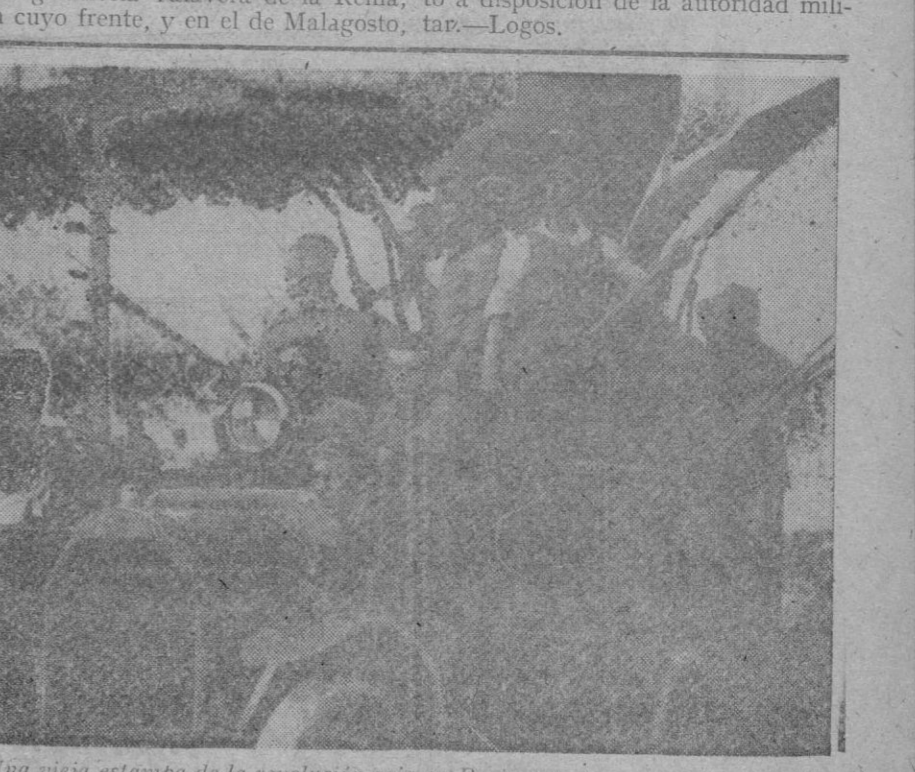
Una vieja estampa de la revolución roja en Rusia, que trae a nuestra memoria tantos y tan dolorosos recuerdos. En este mes se ha cumplido su XXV aniversario, que el soviets quería hacer coincidir con una gran ofensiva, capaz de destruir los ejércitos defensores y salvadores de Europa, para hacer desfilas por las ciudades del viejo continente las hordas del anti Cristo y de la destrucción. Hay gentes desmemoriadas a las que es conveniente refrescarlas la memoria de vez en cuando