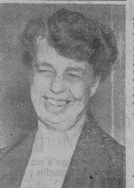
Mrs. Eleanor Roosevelt, esposa del presidente de los Estados Unidos, que se halla en Inglaterra, adonde llegó recientemente

El S. E. U., al repartir libros entre los estudiantes, cumple con uno de los postulados de nuestro Movimiento: hacer revolución entre la clase estudiantil, sin gritos ni falsas propagandas