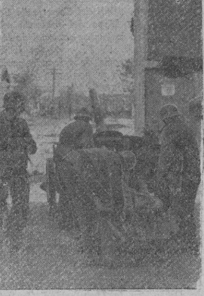
Cañón antitanque alemán emplazado en una de las calles de Stalingrado, para evitar la penetración de tanques soviéticos.

Madrid, 17.—El próximo miércoles día 21, en el centro cultural «Medina», el poeta Manuel Machado dará lectura a su poema dramático «El Pilar de la Victoria», cuyas primicias ofrece a la Sección Femenina.—Logos.