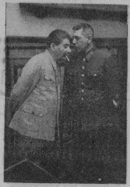
Shaposhnikov, el jefe superior del Ejército rojo, informa a Stalin acerca de la situación militar. —La cosa está que arde, ciudadano Stalin...! —Más bajo, ciudadano Shaposhnikov, que las paredes oyen...