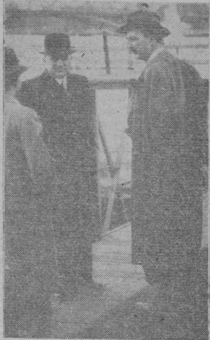
El príncipe Paul Esterhazy (a la derecha), del cual se dice que tiene las mayores probabilidades de ser nombrado vice-reyente de Hungría. El príncipe cuenta cuarenta y un años de edad.