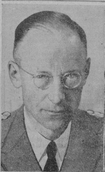
HERBERT BACKE, ministro alemán de Agricultura, que ha decidido aumentar la ración de pan y de otros alimentos en Alemania a causa de la buena cosecha y de que comienzan a llegar al Reich provisiones procedentes de los territorios conquistados en el Este.

A las ocho y cuarto de la tarde, ambas peregrinaciones, en tren especial, emprendieron el viaje de regreso a Madrid, siendo despedidos por el alcalde y varios miembros de la Junta Diocesana.