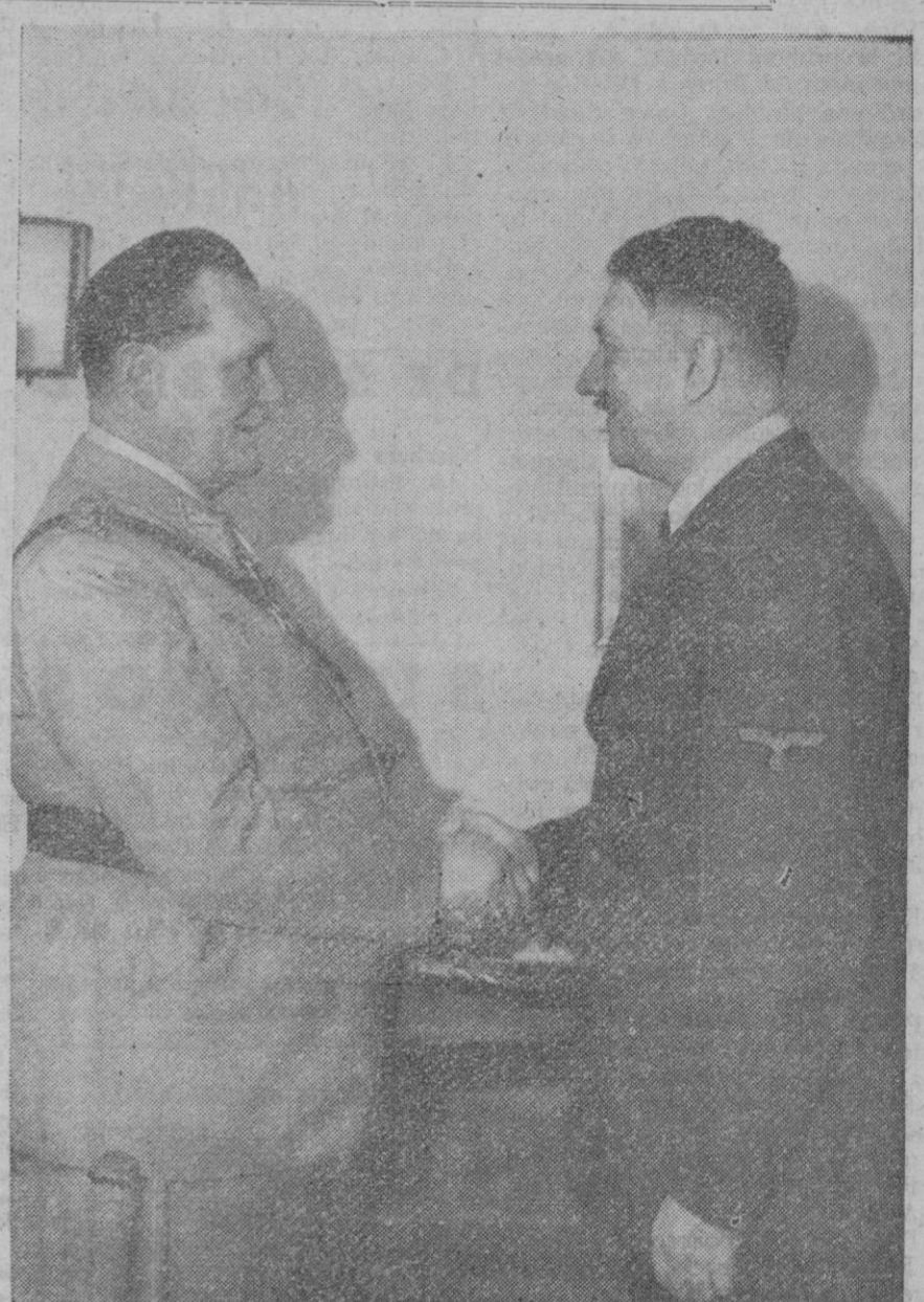
El mariscal Goering (a la izquierda), durante una entrevista con el Führer en el Cuartel General del Canciller

A continuación expresó Goering su agradecimiento a la actitud del pueblo alemán, que ha sido tal—dijo— que sólo en contadísimos casos ha sido necesario ejercer sanciones. «El tipo del mercachifle y del usurero de los últimos años de la Gran Guerra no se conoce casi hoy día, y donde se