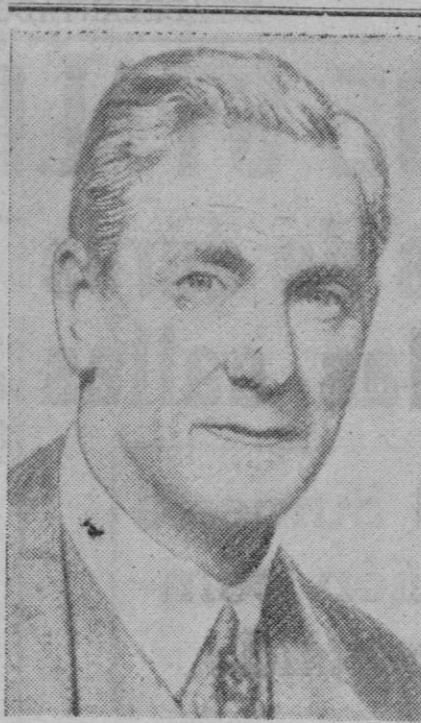
Sir WALTER CITRINE, secretario general de la Federación de Sindicatos ingleses, que exige la abolición de la ley de trabajo de 1927, amenazando con una huelga general para el caso de que no sea atendida su exigencia.

Mutualidad Segoviana de Seguros Juan Bravo, 24