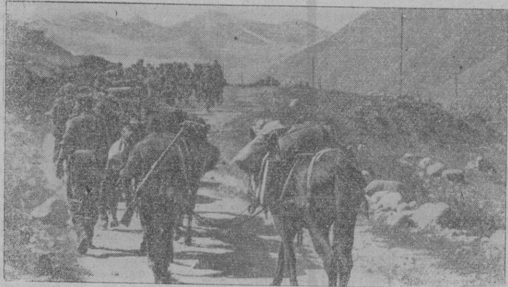
A TRAVES DE LA LLANURA DEL KUBAN.—Cazadores de montaña alemanes durante su avance

Conquista de localidades al Suroeste del lago Ladoga y destrucción completa de los contingentes cercados