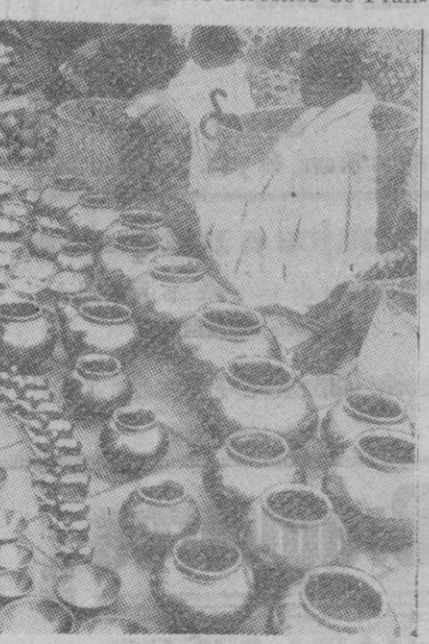
Entre las grandes riquezas de la isla de Madagascar, cuya mayor parte ha sido ocupada ya por los ingleses, figura el granito. En la fotografía vemos el aspecto de un puesto de vasijas de aquel rico mineral en una de las calles de Tananariva