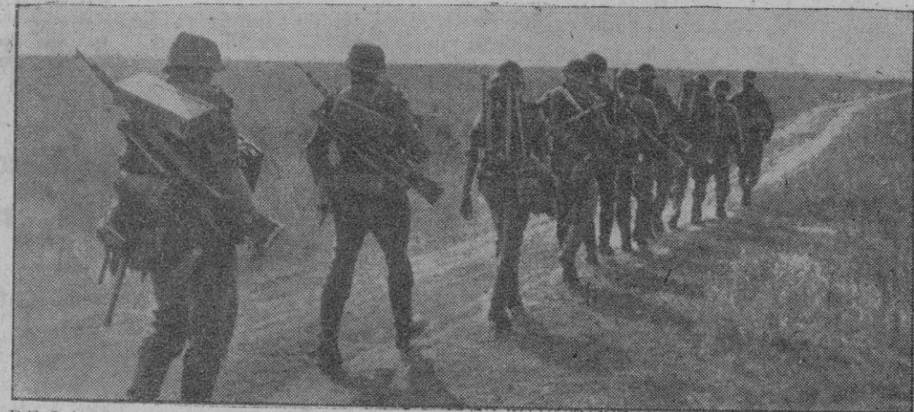
DE LA LUCHA EN STALINGRADO.—Una sección de granaderos blindados ha sido llevada hasta el frente en los tanques y ahora marchan a las primeras líneas para intervenir en la conquista de fortificaciones soviéticas que resisten

Berlín, 3 (2 t).—Los aviones de combate y en picado alemanes continuaron ayer sus ataques en la región de Stalingrado contra los destacamentos soviéticos que se mantienen todavía en la parte septentrional de esta localidad, y arrojaron sus bombas de calibre pesado y superpesado en las posiciones fortificadas y nidos de resistencia. Numerosos cañones soviéticos que disparaban desde las ruinas de las casas han tenido que cesar el fuego a consecuencia de los ataques aéreos ininterrumpidos alemanes. Simultáneamente formaciones de aviones de combate y de bombarderos del Aire norteamericano atacaron el viernes por la tarde los objetivos del Norte de Francia. Numerosas escua-