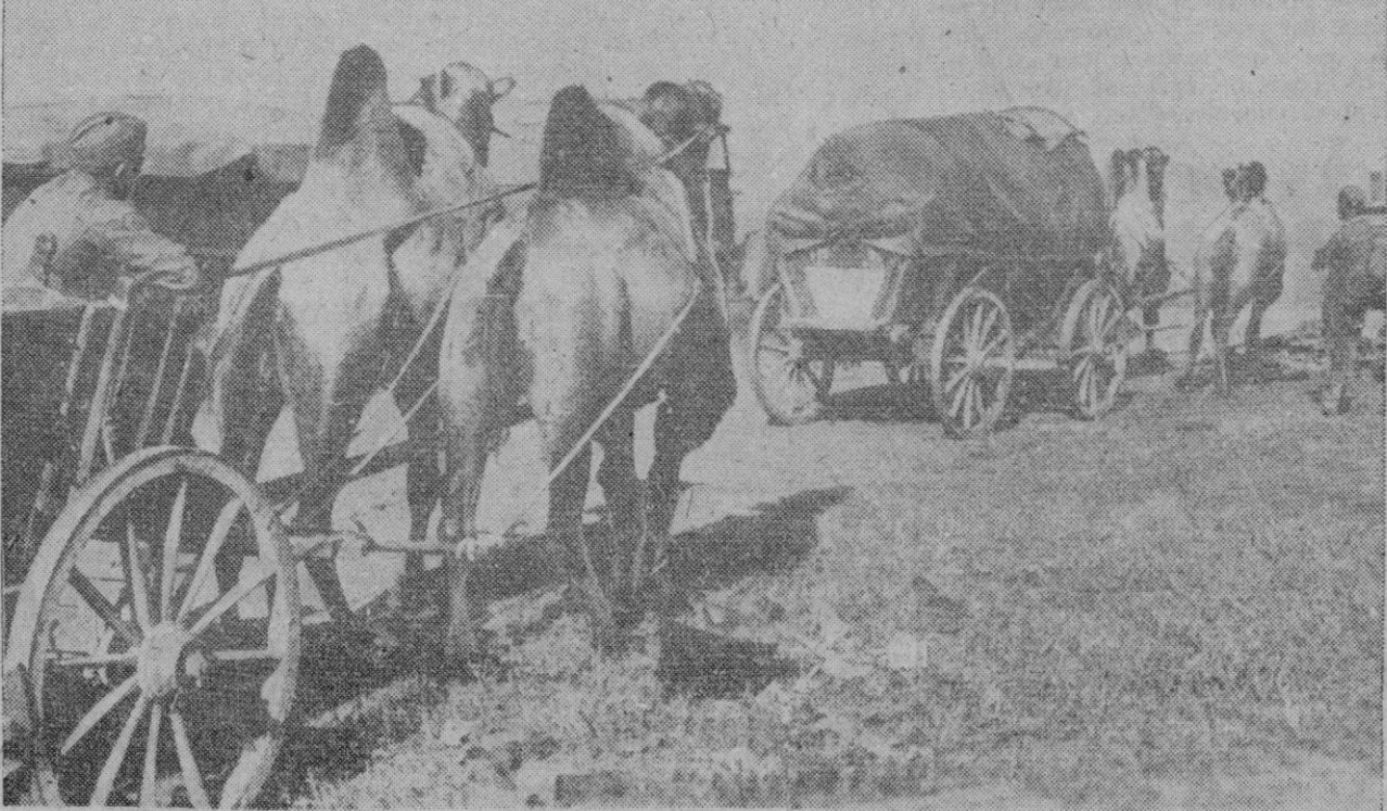
LA GUERRA EN RUSIA.—Carros rusos tirados por camellos, utilizados por las tropas alemanas para servicios de abastecimiento en los territorios del Volga

Estocolmo, 2 (2 t.).—Los defensores de Stalingrado deben luchar hasta morir, según les aconseja el órgano periodístico del Ejército rojo. Y añade: Por dura que sea la empresa, ya no es posible retroceder, y el enemigo debe ser rechazado a cualquier precio.—Efe.