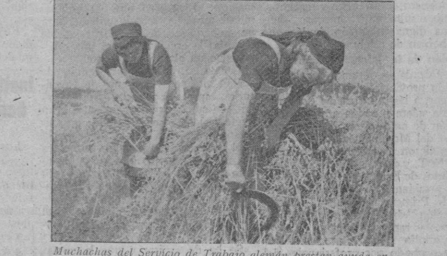
Muchachas del Servicio de Trabajo alemán prestan ayuda en la guerra a los combatientes recogiendo la cosecha.

Vichy, 16 (8 t.).—Los círculos competentes franceses rechazan las alegaciones británicas que intentan quitar importancia a los ataques que en estos momentos sufre la isla de Madagascar. Se pone de relieve que la opinión francesa no se deja influir por la propaganda británica, máxime cuando el territorio francés sufre un ataque por parte de las fuerzas inglesas de mar y tierra.—Efe.