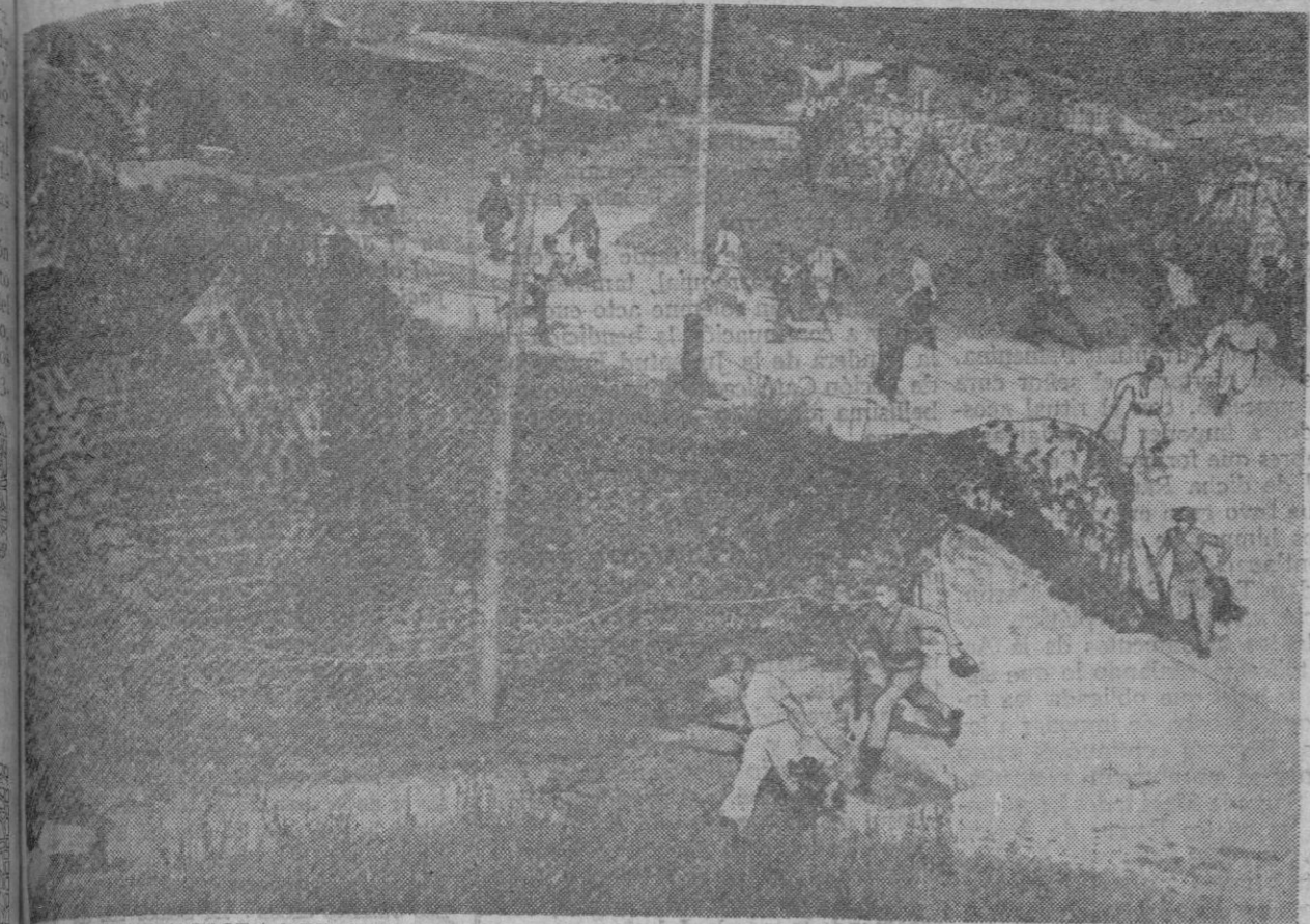
LA LUCHA EN LA COSTA DEL CANAL DE LA MANCHA.—La fotografía nos muestra el momento en que ha sido destruido el acorazado alemán de la costa del canal de la Mancha. Los sirvientes de la artillería de gran calibre, que se halla perfectamente camuflada, corren a ocupar sus puestos. Un minuto después, los cañones podrán entrar en acción.

515 aviones soviéticos han sido destruidos entre los días cinco al quince del actual