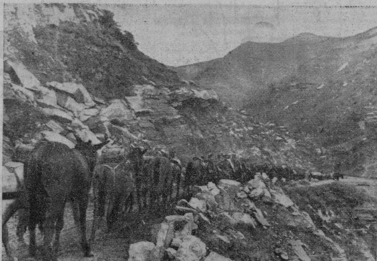
El antiguo Ejército alemán no contaba con más tropas de montaña que las que se formaron en la guerra de 1914-18, según lo imponían las necesidades. En los Dolonitas y en los Carpatos, en los Vosgos y en las montañas de Macedonia, hicieron su prueba de fuego. Actualmente las tropas de montaña forman varias divisiones, sobre todo después de la anexión de Austria, dándoles ocasión de demostrar sus condiciones alpinas en los glaciales de Noruega, en las montañas del Carst, de Servia y de Grecia, en las montañas de Narvik y en las grandes montañas del Cáucaso. En la fotografía vemos una sección de tropas alpinas marchando por un valle de la región caucásica.

Ottawa, 16 (2 t.).—El departamento de Defensa Nacional anuncia que las 3.350 bajas canadienses en Dieppe se descomponen como sigue: 170 muertos, de ellos 40 oficiales; 633 heridos, de ellos 41 oficiales, y 2.547 desaparecidos, de los que son oficiales 130. El coronel Balston, al hacer tal declaración oficial, expresó su simpatía por los que están pasando aflicciones e inquietudes. Por el valor demostrado en Dieppe por los canadienses, auguró la futura victoria.—Efe.