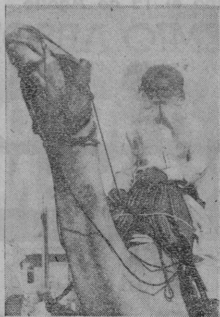
Un indio notable, ricamente ataviado, se dirige en un dromedario al palacio del maharajah para asistir a una fiesta

Nueva York, 1 (2 t.).—El próximo día 7, fiesta del Trabajo, serán botados o comenzada su construcción, más de ciento cincuenta buques de guerra, cuyo número, según se dice en los medios autorizados, jamás fué superado en un solo día.—Efe.