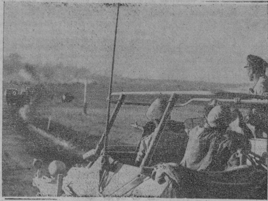
El mariscal Rommel, en su automóvil, marchando en el frente africano entre los elementos blindados

Londres, 31 (madrugada).—El mariscal Rommel ha comenzado una ofensiva contra Egipto, según anuncia la Agencia Reuter.—Efe.