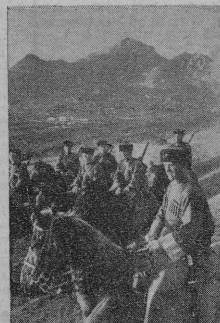
Cosacos de la región de Kubán que participan en la defensa del territorio frente al avance alemán. Al fondo se ven las montañas del Cáucaso

manas en el curso de combates en la región del Oeste de Krimskaya, el día 31 de Agosto, según se anuncia de fuente militar.—Efe.