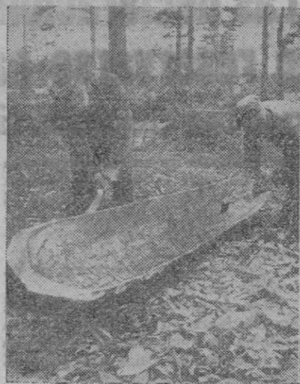
Las canoas son un medio indispensable en verano para el soldado finlandés que lucha en Carelia, lo mismo que los trineos y skis en invierno. Estas canoas son abundantes en bosques, y como los finlandeses son diestros en el manejo del hacha, es cosa fácil que construyan ellos mismos sus canoas. He aquí cómo pulen un tronco hueco que tiene forma de un bote y un detalle del primer paseo en la nueva canoa, a la que se ha dotado de un asiento para dos personas.

Rovno, 18 (5 t.).—El gauleiter Erich Koch, comisario del Reich en Ucrania, trata en el «Deutsche Ukrainian Zeitung» algunas cuestiones relacionadas con la política alemana en Ucrania.