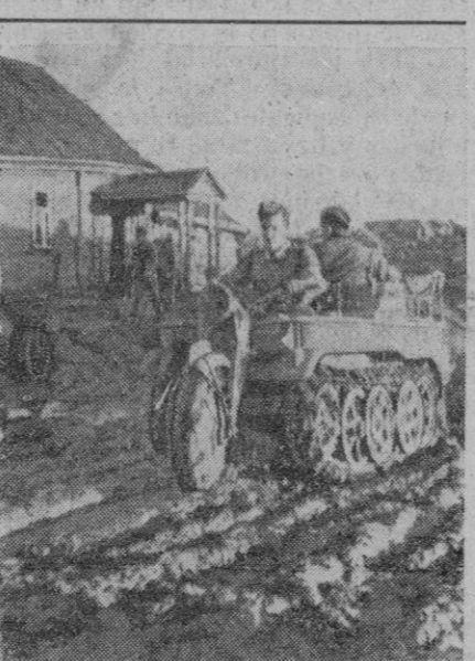
Una nueva invención alemana para la guerra es esta moto, que por abajo es igual que un tanque, muy práctica porque puede avanzar a través del barro y otros inconvenientes de las carreteras rusas, lo que no pueden hacer a veces los camiones, quedándose paralizados

Aviones aliados libraron combate con la aviación enemiga. Uno de los aparatos adversarios fué derribado por el fuego de ametralladora de una «fortaleza volante».