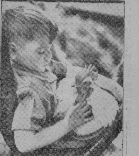
He aquí a un gallo que ocupa el lugar de un perrillo, colocándose en las rodillas de su dueño y pareciendo hallarse contento de sus caricias.

Santiago de Chile, 18 (2 t.).—Se confirma oficialmente que el embajador de la Argentina ha transmitido al presidente Rios una invitación de su Gobierno para visitar Buenos Aires al regresar Rios de su viaje a los Estados Unidos. Según los medios bien informados de la capital argentina, el presidente ha aceptado la invitación.—Efe.