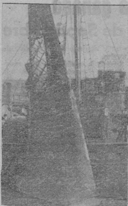
Restos de un avión inglés derribado que intentó cruzar el canal de la Mancha con dirección a la Francia ocupada, son transportados por este barco de guerra alemán.

En otros puntos del mismo sector, los ataques de la infantería y de los carros soviéticos fracasaron ante la enérgica resistencia opuesta por las