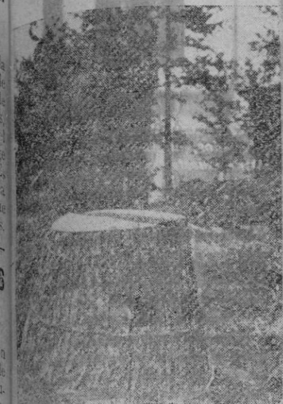
Así como se camufla el soldado ruso. En realidad, esto, aunque aparentemente se toma por un tronco de árbol, es puesto de observación soviético.

Comunicado alemán Cuartel general del Führer, 10 (5 tarde).—Comunicado del alto mando de las fuerzas armadas alemanas: El ataque de las tropas alemanas y aliadas en la región del Cáucaso continúa con éxito, a pesar de la tenaz resistencia del enemigo, de las dificultades del terreno y del calor tropical que se padece.