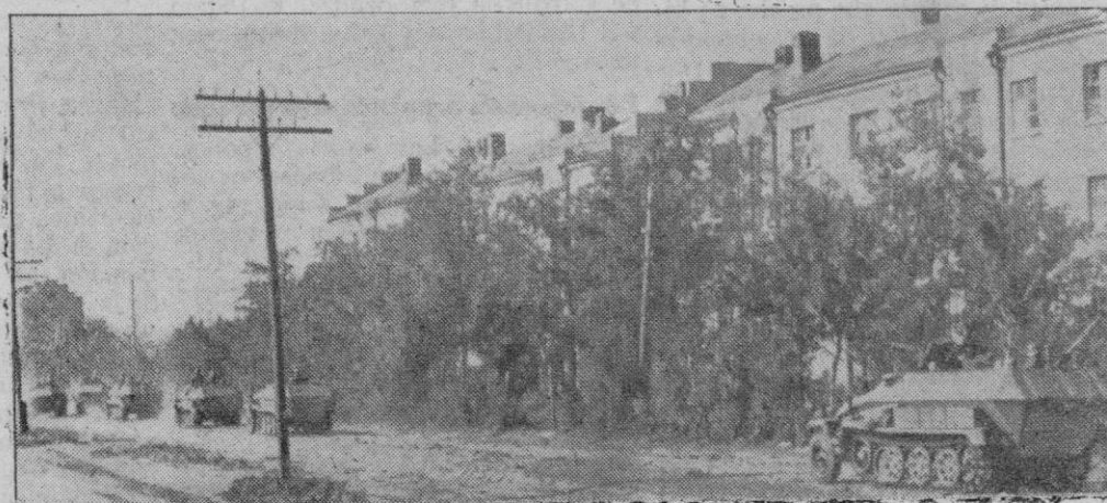
POCO DESPUES DE LA CONQUISTA DE ROSTOK.—Los carros blindados alemanes posan por las calles de la gran ciudad hacia las nuevas posiciones donde se han retirado los bolcheviques.

Los bombarderos y Stukas alemanes les infligieron pérdidas elevadas. Al Norte de Stalingrado, el tráfico ferroviario soviético ha sido objeto de reiterados ataques por parte de la aviación alemana.—Efe.