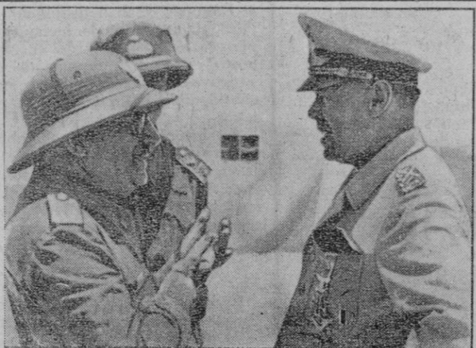
El mariscal Cavallero, jefe del Estado Mayor italiano, felicitando al mariscal Kesselring por la concesión de la Cruz de Caballero con Espadas, premio a la actuación de los aviones a su mando en el frente africano y del Mediterráneo

Nueva York, 7 (2 t.).—El Consejo de producción de guerra ha aprobado un programa de construcción de quinientos hidroaviones «Mars» de setenta toneladas, los cuales serán utilizados para el transporte de cargamentos, según informan de Washington al periódico «New York Times». También ha sido aprobada la construcción de un modelo de prueba de un hidroavión de doscientas toneladas, provisto de dos quillas. Efe.