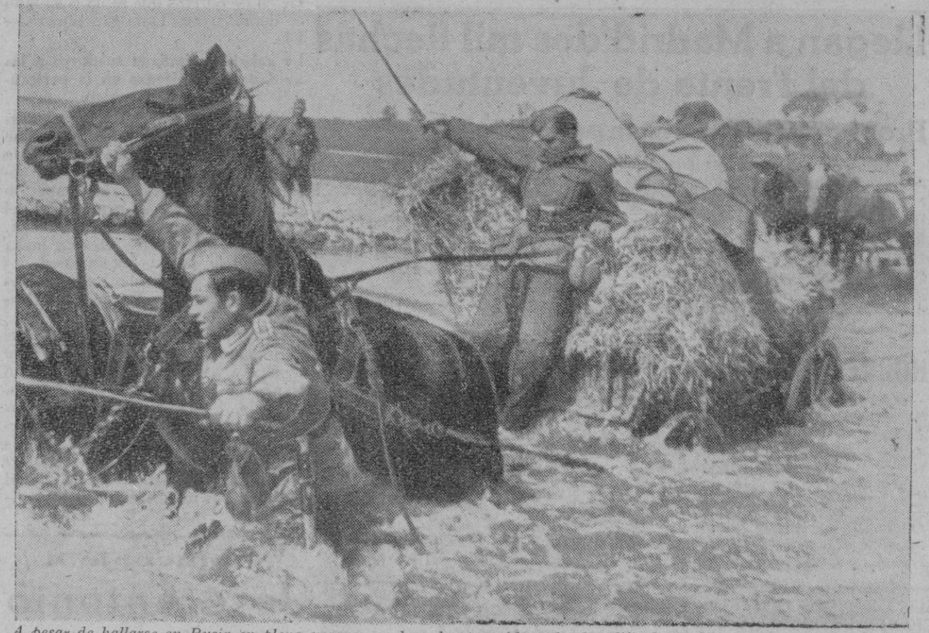
A pesar de hallarse en Rusia en pleno verano, no han desaparecido todas las dificultades que ofrece el terreno al movimiento de las tropas. En la fotografía vemos unos carros regiminales de una división de avituallamiento tratando de atravesar un río

Dice Radio Moscú: Continúa siendo gravísima la situación en el curso inferior del Don