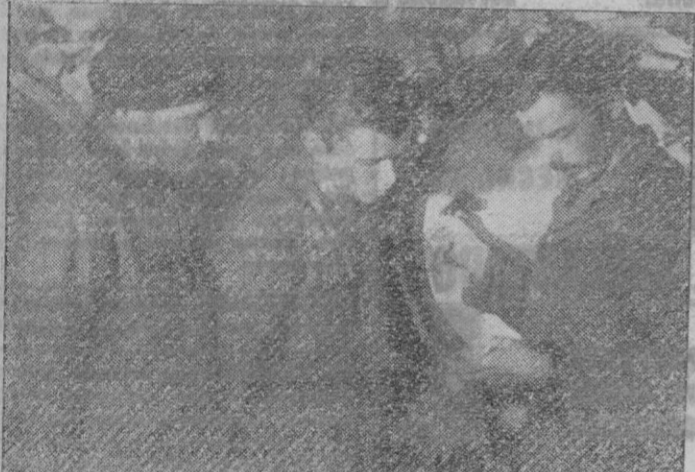
El momento más emocionante a bordo del submarino: El torpedero ha sido disparado y se espera el instante de la explosión

Combate entre un mercante y un avión frente a la costa portuguesa