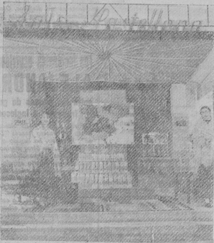
Stand de ANIS CASTELLANA presentado en la I Feria de Muestras de Segovia.