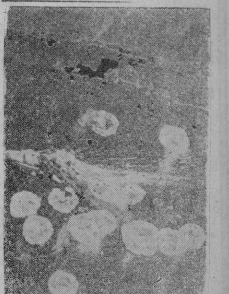
Esta foto, transmitida desde el Japón, nos reproduce el ataque de aviones nipones contra un barco inglés que ha sido alcanzado por una de las bombas.

Paris, 4 (2 t.).—Refiriéndose a los debates en la Cámara inglesa de los Comunes, el "Petit Parisien" declara entre otras cosas: "Nadie quiere ser el sucesor de Churchill. Durante quince horas, la Cámara de los Comunes ha deliberado para comprobar, finalmente, llena de angustia, que el imperio británico está perdido. Inglaterra no puede ya desembarazarse de Churchill. También los franceses sucumbieron a causa de su locura de 1940.—Efe.