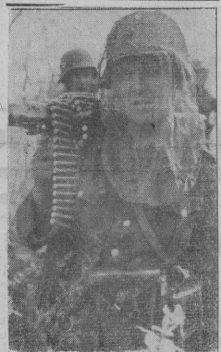
Soldado salemán de ametralladoras, en el frente Sur de Rusia; se dirigen a ocupar la nueva posición ordenada. Para protegerse de los mosquitos, se cubren la cara con una especie de gasa.

Otra nota no menos interesante es la admisión, como células integrantes del Organismo Sindical de los Sindicatos (Continúa en la página 2.)