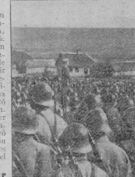
El mariscal Antonescu, jefe del Estado rumano, se dirige a sus soldados, que tan sobresaliente papel han tomado en la batalla de Charkov