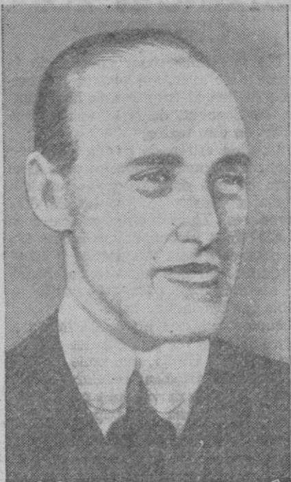
Lord Swinton, que ha sido nombrado ministro británico en Africa

Durante la noche última una poderosa formación de nuestros bombarderos efectuó una incursión sobre el Noroeste de Alemania. Bremen, el objetivo principal de este ataque, fué bombardeado intensamente. También han sido atacados los aeródromos enemigos de los territorios ocupados. La caza en servicio de patrulla ofensiva, atacó los objetivos ferroviarios de la Francia ocupada y la navegación enemiga frente al litoral francés. Nueve de nuestros bombarderos no han regresado de estas operaciones.—EFE