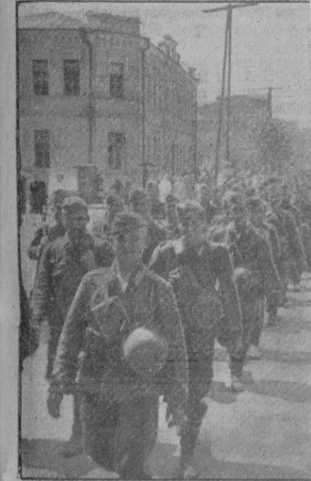
Divisiones de soldados alemanes marchan a través de las calles de Charkov

Si lo necesitas y lo mereces, pide tus libros al S. E. U., que te los prestará