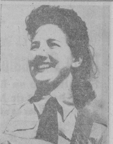
Australia cuenta también con una organización femenina para colaborar en la defensa pasiva del país. En el grabado vemos una joven australiana vistiendo el uniforme de la organización

asisten a las maniobras de la División motorizada de su guardia Londres, 22 (2 t.)—Por primera vez desde la motorización de la división de la Guardia, el Rey Jorge y la Reina Isabel y María han asistido a las maniobras de dicho Cuerpo. Los soberanos permanecieron ocho horas entre sus soldados, recorriendo el terreno en automóvil.—Efe.