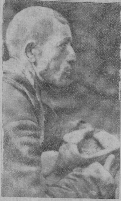
Miseria en el ejército rojo. Este prisionero habla del hambre que ha sufrido. Ha tenido que comer los granos de avena destinados para los caballos

El gobernador civil obsequió al señor presidente de la Diputación y acompañantes con una copa de vino español.