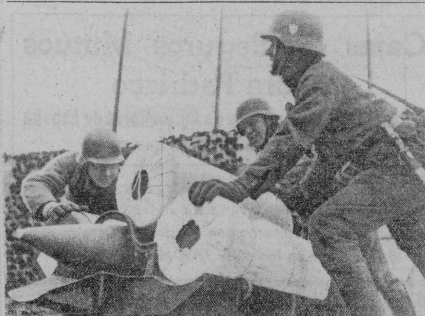
Gigantescas granadas para los grandes cañones alemanes de la costa del canal de la Mancha

Otros soldados indígenas han sido libertados al mismo tiempo y el mismo día, en Samarang y Surabaya.