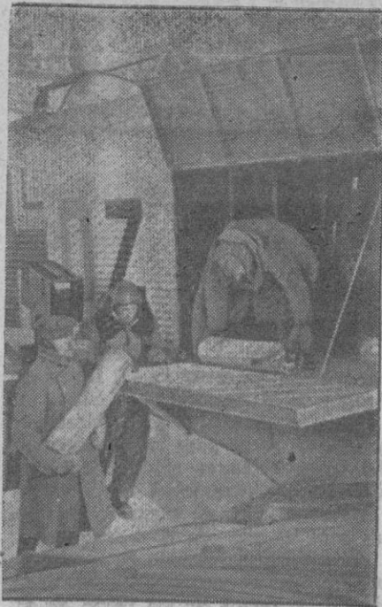
Ahora que el deshielo dificulta las comunicaciones en Rusia, los grandes aviones de transporte alemanes llevan, como en el invierno, los abastecimientos a las posiciones avanzadas alemanas. He aquí la descarga de municiones de un avión

Alicante, 12.—En Benijofar se ha colocado y bendecido la primera piedra de diez viviendas protegidas que formarán parte del grupo "Onésimo Redondo", para la C. N. S. Asistió el delegado provincial sindical.—Logos.