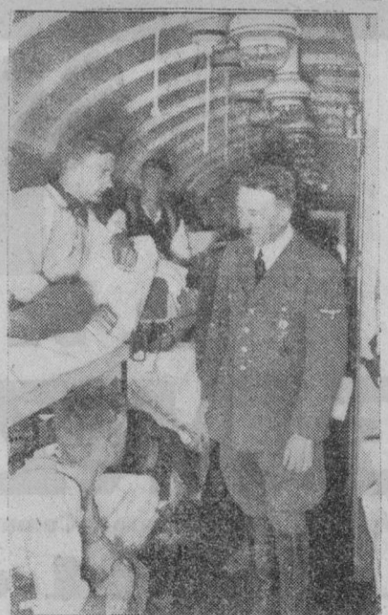
El Führer saluda a los heridos de un tren hospital que se dirige a la retaguardia

En Barcelona, muy minada por los austriacos desde los tiempos de Carlos II, en que era su Virrey el Príncipe de Darmach, se congregaron los núcleos de resistencia a favor de Carlos III de Austria. Por varias veces Felipe V, dueño absoluto de la extensión geográfica española, trató de recuperar Barcelona. A esa empresa le ayudaron ejércitos franceses, mandados por mariscales de tanta fama como Tessé, Noailles y Berwick. Pero nada consiguió. Por uno o por otros motivos, tuvo que levantar el asedio y trasladar sus fuerzas a otros lugares. Así aconteció en tal día 12 de Mayo de 1706, a pesar de que había dado, y con éxito, diferentes ataques a la ciudad sitiada. Barcelona resistía, y esa resistencia le llevó, muy a pesar suyo, a levantar las tiendas y cegar las trincheras. La principal ciudad catalana, desprendida de la Corona de España, era un triste espectáculo para un Rey tan amante de la unidad como lo fue Felipe V. Pero las circunstancias mandan, y Barcelona vivió otra vez, y durante algún tiempo, la causa del Pretendiente austriaco, casi ya definitivamente perdida.