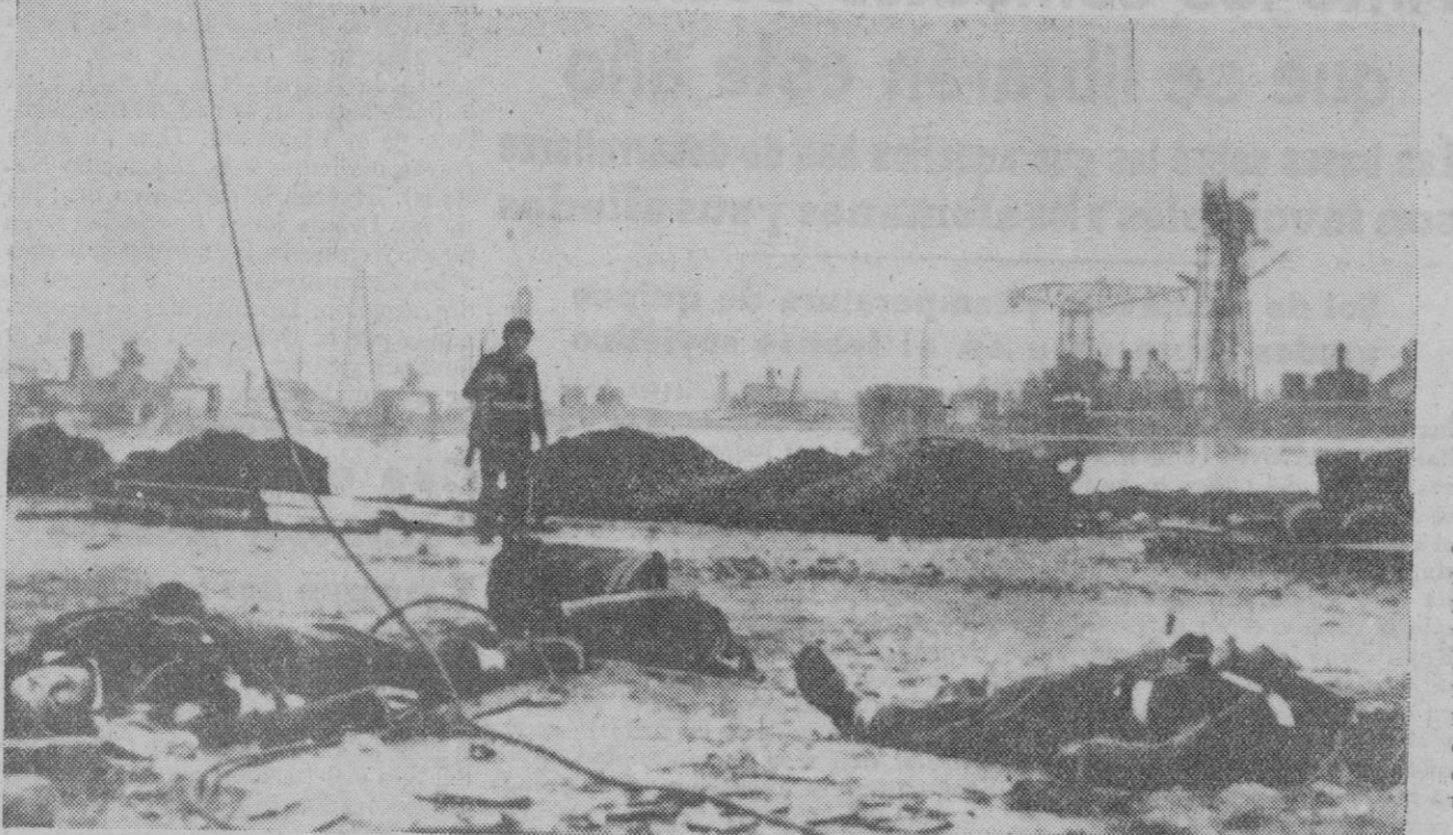
Telefoto del asalto inglés a Saint-Nazaire, donde se libraron violentos combates entre las fuerzas especiales británicas de la flota, de la aviación y del ejército de tierra, y las tropas alemanas de defensa. La resistencia opuesta por las últimas fué extraordinaria, pasando luego al ataque contra los puestos donde los británicos se hicieron fuertes, hasta destruirlos o reducirlos.

Prosiguen, en oleadas sucesivas, los ataques contra Malta