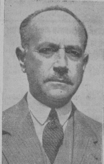
HENRI HAYE, embajador francés en Washington, que entregó la nota de protesta de su Gobierno por el nombramiento de un cónsul norteamericano en el territorio de Africa ecuatorial que los "degauillistas" tienen en su poder.

Y de ese convencimiento debe nacer una estrecha colaboración con el Estado en esta campaña que se está dibujando en el ambiente por el abaratamiento de la vida. Labor difícil, indudablemente. Pero labor que es preciso realizar. Nos damos cuenta de que la lucha ha de ser dura. Escasean los productos, abundan las masas de dinero, hay cierta inclinación al gasto fácil. Pero al mismo tiempo hay un exceso de avaricia, de codicia, de afán de realizar fáciles y prontas ganancias, aprovechándose de esta turbiedad de las aguas de la economía del país. Y es ahí, en la formación de un espíritu general de sacrificio, donde debe fundamentarse la política de colaboración ciudadana con la obra de vigilancia y disciplina del Estado. Todos y cada uno de los españoles deben darse cuenta de los problemas que tiene que afrontar el Gobierno y deben unirse, disciplinadamente, en la misma línea de conducta para que las soluciones sean más fáciles, ya que nunca podrán ser fáciles. La campaña para el abaratamiento de la vida debe ser una campaña de la máxima solidaridad nacional.