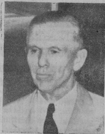
El general Marshall, jefe del Estado Mayor norteamericano, que acaba de regresar de Londres, donde ha celebrado conversaciones con los jefes militares ingleses acerca del escenario general de la guerra.

Melbourne, 22 (3 t.).—El destructor australiano «Vampir» fué hundido cuando, en unión de otro buque británico, atacaban a fuerzas navales japonesas, numéricamente superiores, en el golfo de Bengala, pese a lo cual lograron hundir un destructor nipón y averiar gravemente a otro. Entre los desaparecidos del «Vampir» se halla el comandante del mismo, Morán.—Efe.