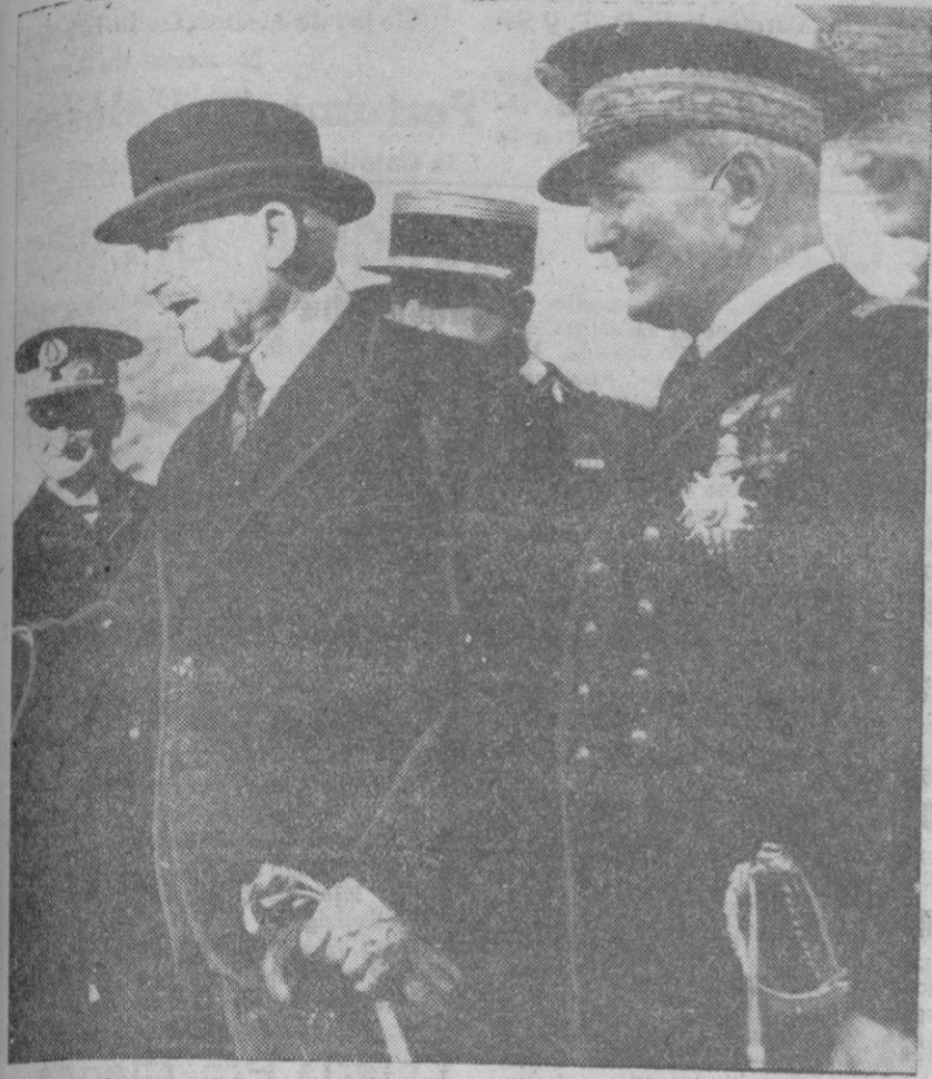
He aquí al mariscal Pétain y al almirante Darlan, en los cuales se concentra la atención mundial por el nuevo rumbo que, al parecer, se disponen a imprimir a los destinos de Francia, al facilitar a Pierre Laval el retorno al Poder bajo el signo de la colaboración francesa con la nueva Europa.

Dicho personaje ocupa, además de la Presidencia, tres ministerios. Integran el nuevo ministerio cuatro ministros, 16 secretarios de Estado y dos secretarios generales.