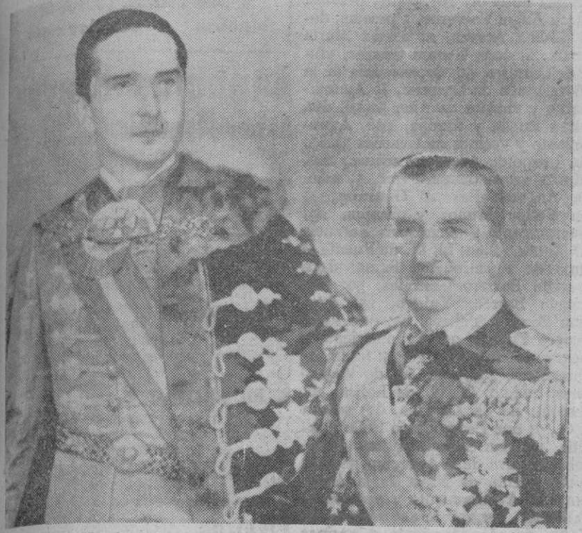
El almirante Horthy, regente de Hungría, fotografiado por primera vez con el hijo Esteban, después de haber sido éste nombrado por el Parlamento sucesor permanente de su padre en la regencia

El Regente HORTHY condecora al embajador español