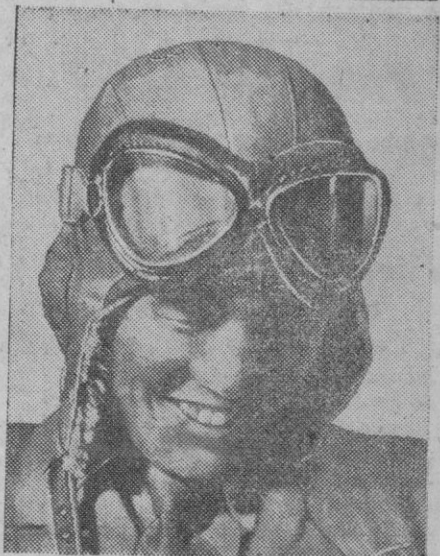
Este periodista japonés está equipado exactamente igual que los aviadores. Y es que tiene la misión de ir en un bombardero durante un raid sobre el Pacífico, para poder enviar sus crónicas de las operaciones de guerra vistas por él mismo.

Las mujeres inglesas y los servicios auxiliares de las fuerzas armadas Londres, 28 (2 t.).—Las mujeres británicas que tengan en la actualidad diecisiete años realizarán hoy su presentación en las Cajas de Reclutamiento establecidas al efecto, para ser destinadas a servicios auxiliares de las fuerzas armadas de Inglaterra. Se anuncia que los miembros de las oficinas de reclutamiento estarán ayudando en su labor por representantes de