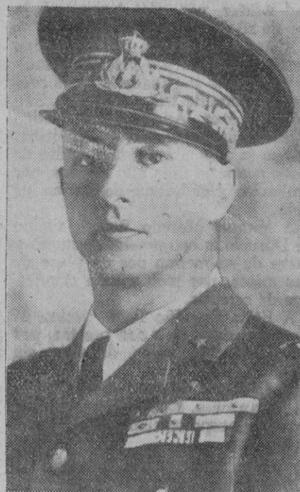
El general Rino Corso Fougier, jefe de la aviación italiana, a quien el mariscal Goering ha concedido una alta condecoración por los éxitos aéreos alcanzados en el Mediterráneo y sobre Malta.

Lisboa, 9 (5 t.)—Según los últimos datos de las elecciones presidenciales, el general Carmona ha alcanzado en ellas 223.058 votos más que en las elecciones de 1937.—Efe.