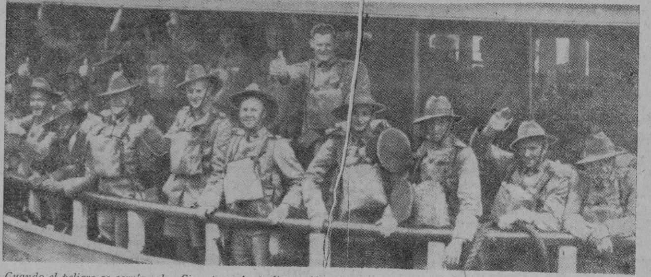
Cuando el peligro se cernía sobre Singapur, Australia envió al "Gibraltar del Extremo Oriente" importantes contingentes de tropas. En la fotografía vemos a un contingente de soldados a bordo de un buque-transporte en el momento de zarpar del puerto de Sidney con rumbo a Singapur, donde los japoneses han hecho inútiles todos los esfuerzos del adversario para evitar la pérdida de la famosa fortaleza.

El comandante general australiano logró escapar de Singapur