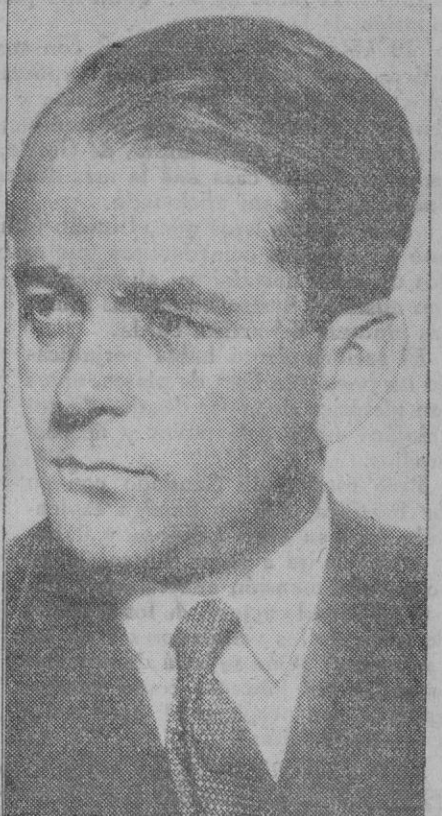
El reichsministro alemán, profesor Albert Speer, sucesor del doctor Todt, recientemente fallecido