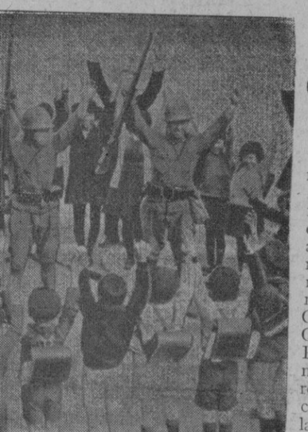
Los niños de una escuela japonesa en Malasia saludan alborozados a sus compatriotas que han conquistado la aldea.

Ginebra, 24 (2 t.).—El jefe del partido conservador inglés, sir Douglas Hacking, ha presentado a Churchill su dimisión, según informan de la capital británica. Churchill—continúa la información—ha tomado nota de esta dimisión con verdadero sentimiento.—Efe.