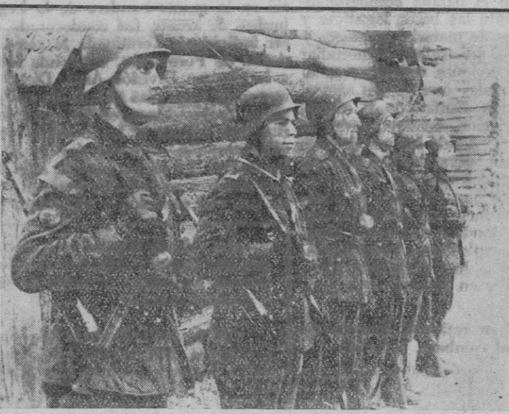
Miembros de la División Azul, condecorados, por sus hechos heroicos en la lucha contra los soviets, con la Cruz de Hierro, se encuentran aquí formados para serles impuesta la Laureada colectiva