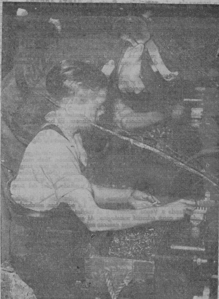
FABRICACION DE MUNICIONES.—He aquí a un niño de trece años trabajando en una fábrica de municiones de guerra durante una visita girada a la misma por el Rey Jorge

Estocolmo, 3 (5 t.).—El corresponsal en Londres del diario "Dangs Nyheter" informa que en la capital británica y en Washington se han recibido noticias del pesimismo que reina en Chung-King después de las victorias logradas por los japoneses. Wellington Kood, embajador de China en Londres, ha declarado, según dicho corresponsal, en una visita que hizo a Eden, que China tiene gran necesidad de aviones, de artillería antiaérea y de municiones, y expresó su esperanza en que las entregas de material serán aceleradas.—Efe.