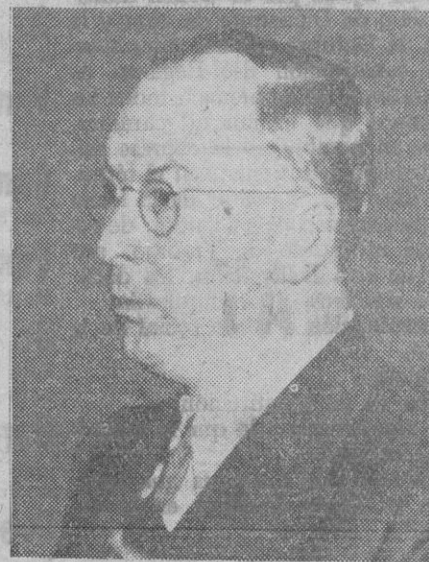
DONALD MARR NELSON, nuevo presidente del Consejo Nacional para la producción de guerra de los Estados Unidos

Berlín, 3 (5 t.).—La Agencia oficial alemana dice: «Berlín no se ha mostrado sorprendido por la forma en que ha reaccionado la Prensa sueca ante las nuevas medidas adoptadas en Noruega para instaurar un nuevo orden. Aquí se toma nota de los ecos negativos de estas publicaciones, las cuales expresan en las actuales circunstancias la desilusión que produce el carácter irrealizable de las tendencias políticas asociadas por Suecia con una Federación nórdica. Se pone de relieve en Berlín un comentario del "Tatebers Handöls", según el cual el destino de Suecia y de Noruega dependerá de la flota inglesa y del ejército soviético, porque este diario se hace eco de una opinión que puede ser ya interpretada como contraria al pensamiento europeo».—Efe.