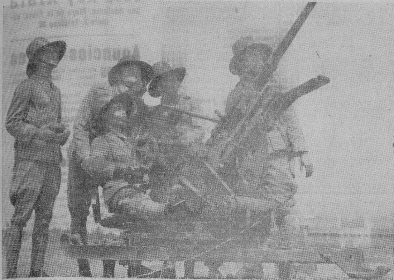
LA DEFENSA DE JAVA.—El general Wavell ha trasladado su Cuartel general a Surabaya, puerto importante de la isla de Java, en cuyas obras de fortificación están empleados dieciocho mil obreros. Vemos en la fotografía a un grupo de soldados japoneses realizando prácticas con un cañón de la defensa antiaérea en las afueras de Surabaya

En el ataque que están preparando las fuerzas japonesas La casi totalidad de la isla de BORNEO está ya en poder de los nipones