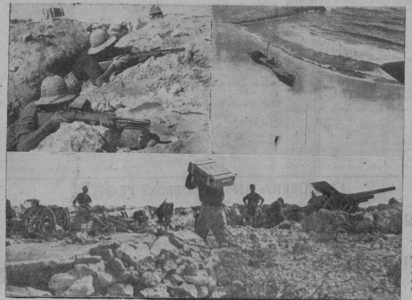
Breve ha sido la etapa de descanso en la Marmárica, después de las grandes batallas libradas últimamente. Los ataques ingleses se han reproducido con renovado vigor contra las posiciones del Eje. Las presentes fotos recogen diversos aspectos de las actividades bélicas en el frente de Tobruk. Arriba, a la izquierda, una sección de soldados italianos ocupando sus puestos de observación en la línea de fuego. A la derecha, un navío británico hundido cerca de la costa. Abajo, el emplazamiento de una batería italiana.

También son rechazados en el Este los ataques soviéticos. Actuación de potentes escuadrillas alemanas