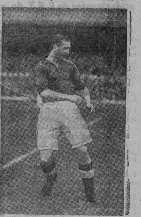
encuentro, de no torcerse las cosas, le dará la tranquilidad absoluta.