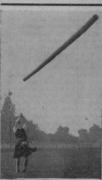
Los escoceses son, como se sabe, hombres fuertes, lo que caracteriza sus deportes nacionales, entre otros el lanzamiento de barras. Este escocés está fotografiado en una exhibición en Londres