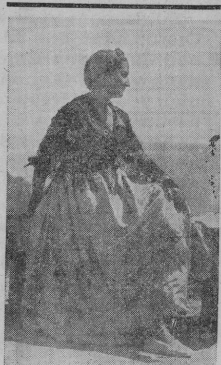
Esta fotografía de una encantadora seño catalana, vestida con el traje típico de su región, aparece en una Exposición de "Arte fotográfico", de Londres, y ha merecido el título de "la mejor fotografía del año". Fue tomada por un fotógrafo inglés en las cercanías de Barcelona

Las restricciones señaladas en la norma primera de la Orden de 13 de Noviembre último para que continúen presentes en filas los voluntarios que mediante contrato especial prestan servicio en Cuerpos del Ejército, quedan subsistentes hasta que los interesados extingan totalmente el compromiso contraído.—Logos.