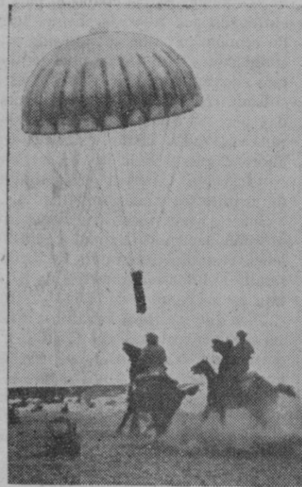
Se trata de maniobras militares en el Estado de Texas (Estados Unidos). Un núcleo de fuerzas cercadas por el "enemigo" recibe provisiones y medicamentos por medio de paracaídas