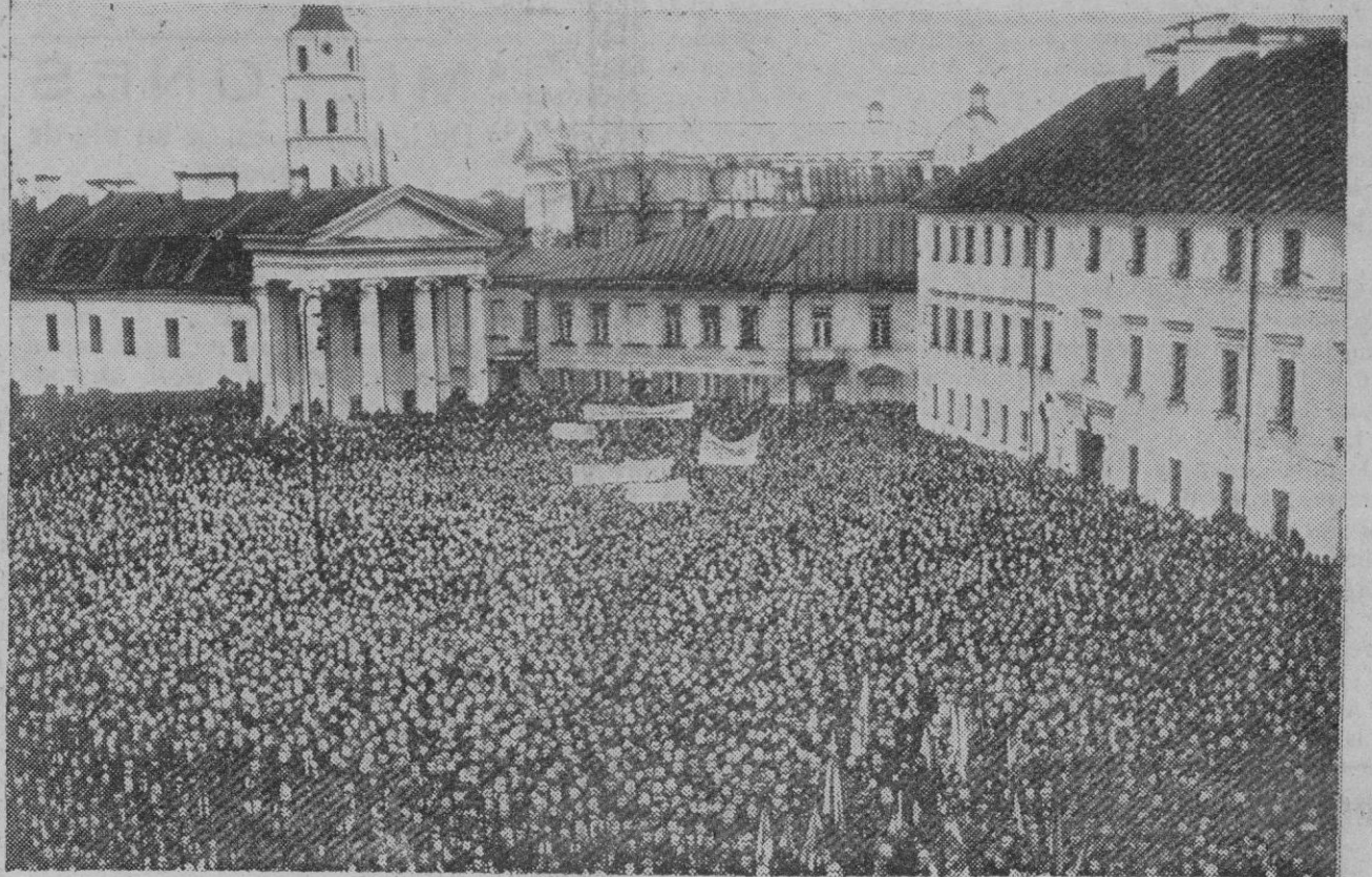
Una demostración polaca en Vilna, antigua capital de Lituania, durante la tirantez lituano-polaca de 1937 a causa de haber reclamado nuevamente el Gobierno de Kovno o Kaunas la devolución de aquella provincia de la cual se apoderaron los polacos en 1920. Actualmente Lituania ha presentado con carácter grave sus reivindicaciones a Polonia.

En 1929, el Consejo Supremo de los aliados determinó la frontera provisional de Polonia con Lituania, adicionando al territorio de este último país la provincia y ciudad de Vilna. Al ser atacada Lituania por los bolcheviques en 1919, el Gobierno lituano se trasladó a Kovno. Meses después, los polacos entraban en Vilna después de derrotar a los rusos, pero durante la infructuosa campaña de Polonia sobre Ucrania, los lituanos recuperaron Vilna. Firmada la paz en Julio de 1920 entre Rusia y Lituania, el Gobierno soviético reconoció los derechos de Lituania sobre Vilna. Con posterioridad se firmó un acuerdo entre Lituania y Polonia por el que Vilna era reconocida como territorio lituano, pero el 9 de Octubre de 1920 el general polaco Zeligowski se apoderó de Vilna, que desde entonces ha quedado en poder de Polonia sin que en momento alguno Lituania haya hecho dejación de sus derechos sobre Vilna y su provincia, por lo cual la cuestión nunca ha estado zanjada.