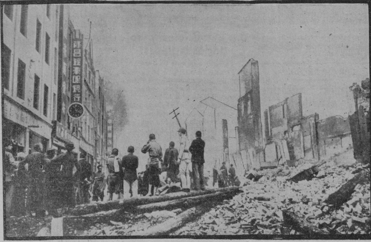
Una calle de Chungking, capital provisional de China después de un bombardeo de la aviación japonesa. En esta capital se encuentra establecido el Gobierno del mariscal Chan Kai She