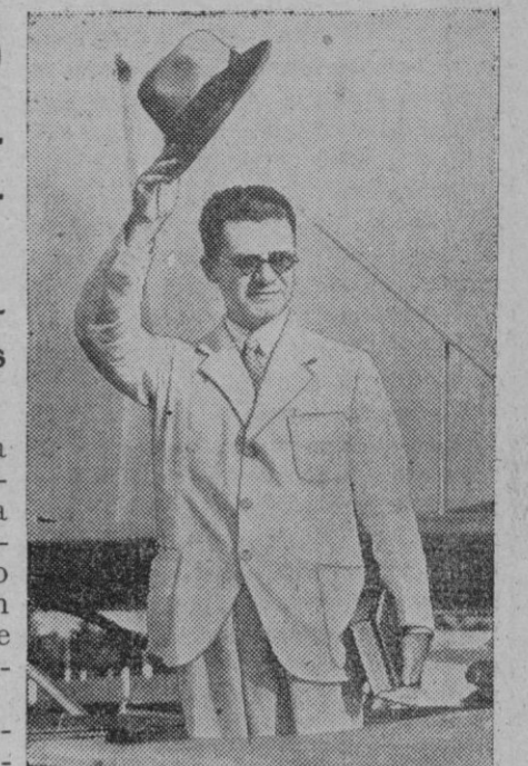
El general Estigarribia, héroe de la guerra del Chaco

Asunción, 15.—El nuevo Presidente del Paraguay, general Estigarribia, ha jurado hoy el cargo ante el Parlamento.—Mundial.