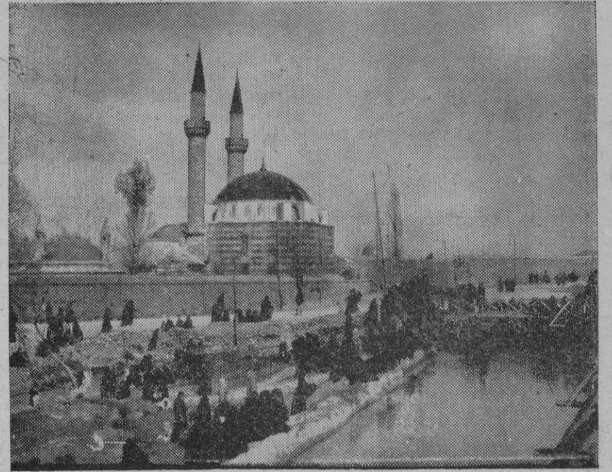
Una vista de Damasco

Berlín, 20.—Comunican desde Damasco que las tropas francesas han ocupado los edificios principales y puntos estratégicos de la ciudad habiendo quedado prohibidas las manifestaciones públicas.