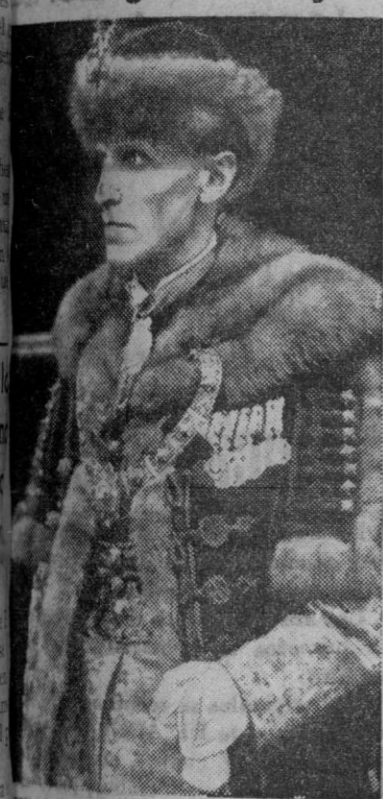
El jefe del Gobierno húngaro señor Imrédy que, con el regente Horthy, conducen a la nación húngara por el camino del progreso

Burgos, 20.—Con motivo de celebrar hoy Hungría su fiesta nacional (San Esteban) el Generalísimo Francisco Franco ha enviado al Regente Horthy, un telegrama de felicitación, en el que Excelencia hace votos por la prosperidad y bienestar del pueblo húngaro y de su Regente.