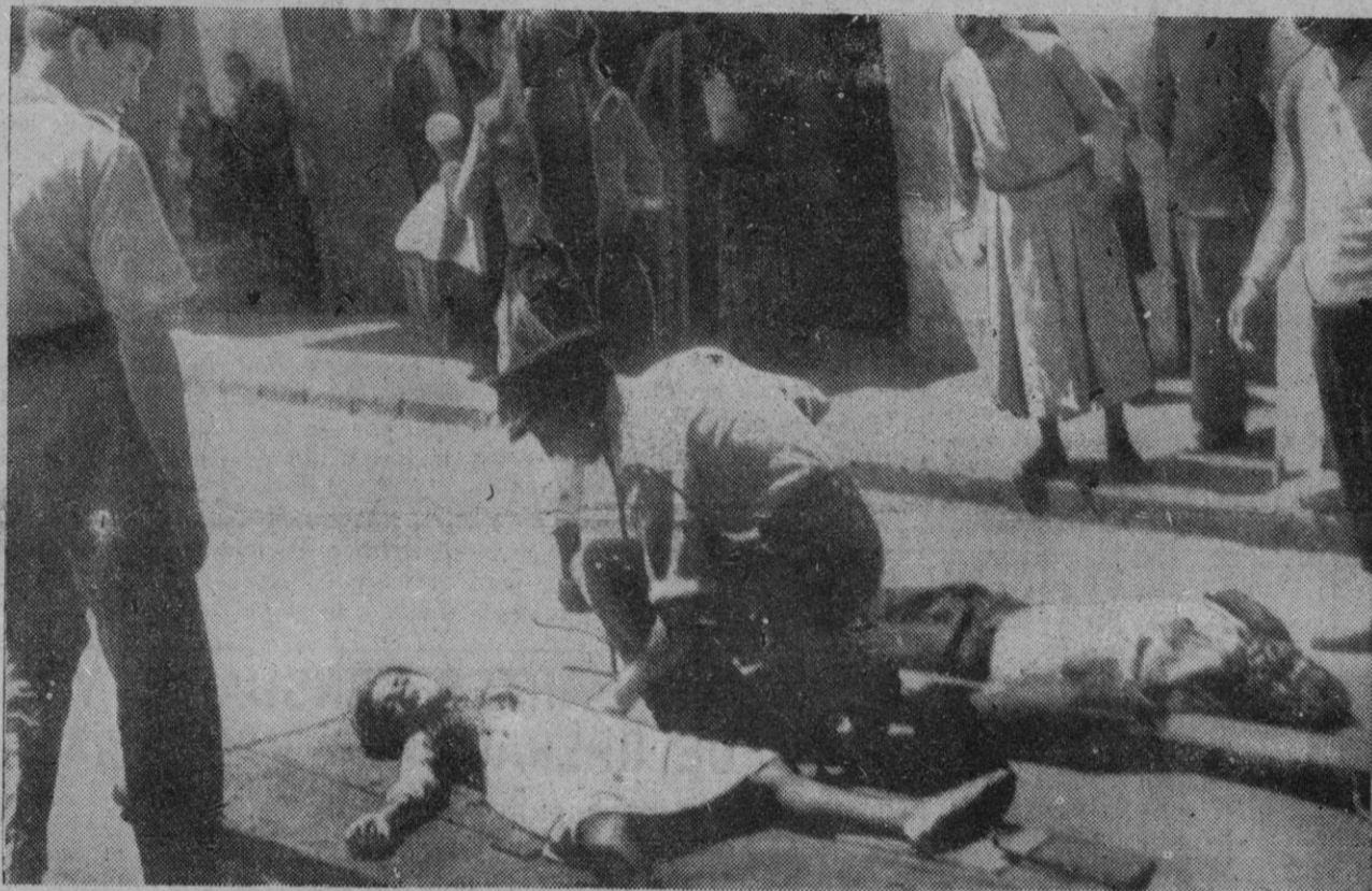
Victimas de la explosión de una bomba en Jerusalén, atendidas por un sanitario británico

Jerusalén, 19.—Las fuerzas de Policía y del Ejército han iniciado, con las primeras luces del alba, operaciones envolventes de castigo contra las bandas de árabes armados que se habían hecho dueñas de los alrededores de Jerusalén. La aviación ha participado en las operaciones. Cuando varios aparatos procedían a un intenso bombardeo contra los contingentes árabes, uno de los aviones capotó y se estrelló contra el suelo, pereciendo el piloto y el observador. Las fuerzas de tierra registran un soldado de la guardia escocesa muerto y cuatro heridos.