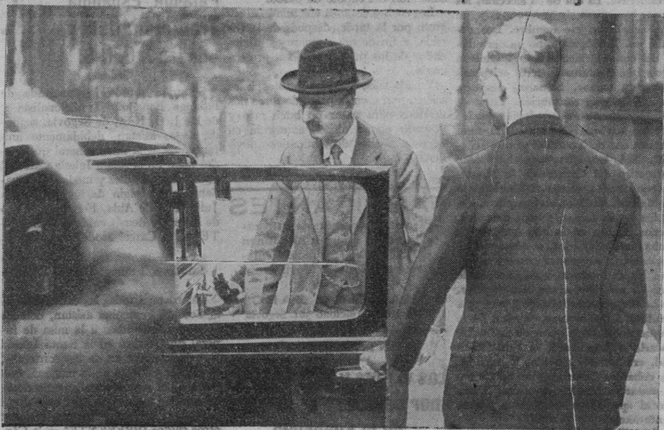
LA INQUIETUD EN LA POLITICA GENERAL.—El primer ministro de Inglaterra Mr. Chamberlain, que interrumpió sus vacaciones a causa de las complicaciones registradas en la política internacional, aparece en la foto en el momento de llegar a su residencia de Londres. Parece que tanto Mr. Chamberlain, como lord Halifax y los demás ministros que regresaron a Londres por el mismo motivo, volverán al campo en vista de haberse aclarado un tanto el horizonte político internacional

Washington.—Un representante de las asociaciones nacionales ha demostrado ayer documentalmente ante el Peace and Democracy, la American Comité parlamentario que se ocupa