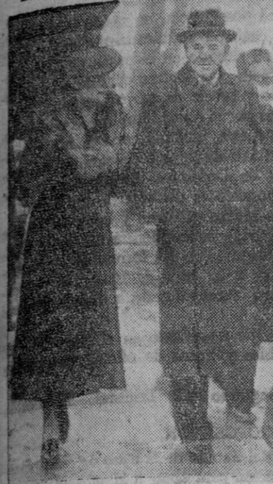
El mariscal von Blomberg, que ha estado en el ministerio de la Guerra, emprende, con su distinguida esposa, un viaje de recreo por Italia