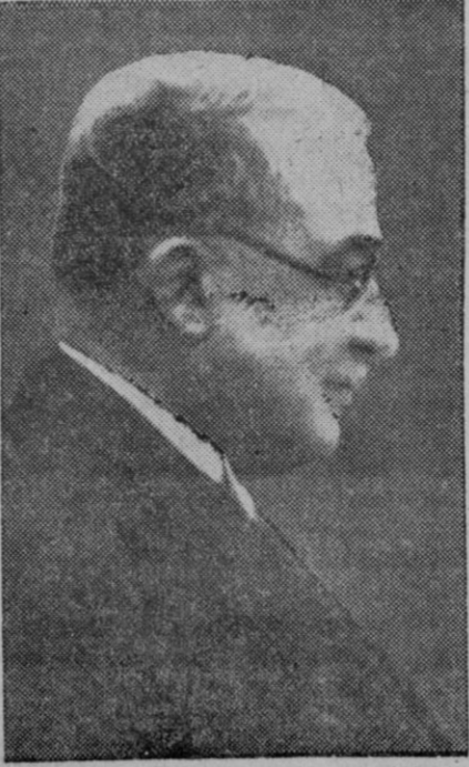
El general Metaxas, primer ministro, proclamado dictador nacionalista con la anuencia del Rey