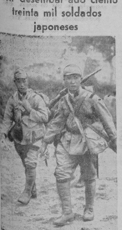
Soldados japoneses patrullando en el frente de Peiping

El convoy marítimo estaba formado por cincuenta barcos mercantes protegidos por la escuadra.