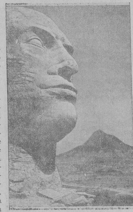
Talla en piedra, hecha en Adua por los soldados italianos

Impreso por la editorial Novissima Roma, hemos recibido un interesantísimo folleto que contiene el curioso