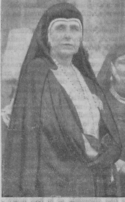
La Reina María, de Rumania, que sufre una grave enfermedad que ha paralizado sus piernas