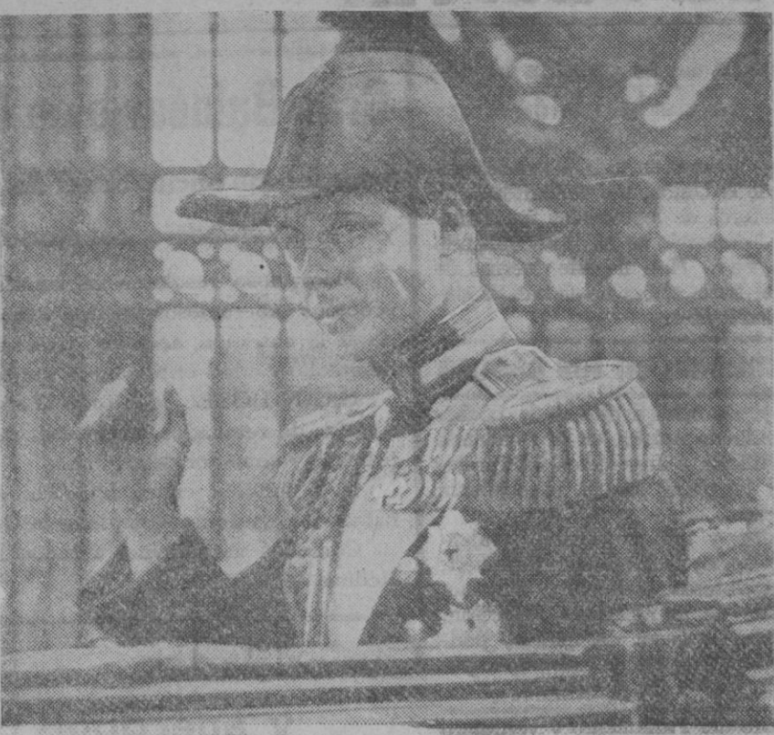
El Rey Eduardo VIII de Inglaterra contra cuya vida se ha atentado esta mañana mientras pasaba revista a la guardia. Afortunadamente el atentado pudo frustrarse

La casa de los segovianos en Madrid, os ofrece nuestro paisano situado en el mejor sitio de la capital, Carrera de San Jerónimo, 34, 2.ª, esquina a Santa Catalina, quince balcones, baños, ducha, teléfono 29492. Estancia agradable, trato camarero. Pensión completa, desde 6 pesetas Se sirven cubiertos a precios reducidos