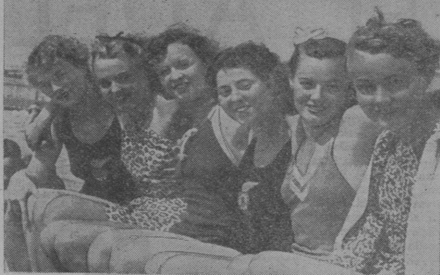
Un grupo de nadadoras de los Estados Unidos que representarán los colores americanos en los Juegos Olímpicos de Berlín.

Los del Eslava, chutan más, pero sus «notas» no parecen naturales, olvidándose que el pentagrama de la meta está más abajo, hasta que Rojo,