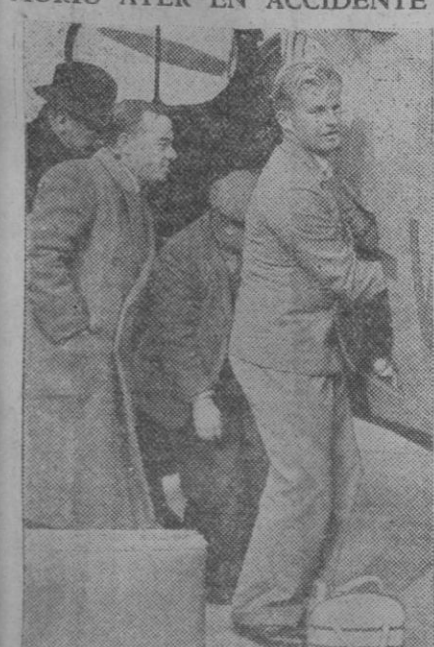
El joven aviador australiano Melrose, que había alcanzado gran celebridad por los éxitos obtenidos, resultó muerto ayer al caer a tierra el avión que pilotaba. Ha ocurrido el accidente cuando de regreso de Inglaterra se disponía a tomar tierra en Australia, su patria. En la foto aparece momentos antes del vuelo, aprovisionándose para el viaje al final del cual ha encontrado la muerte.

Por prestigio de la República, de las instituciones sociales y del buen nombre de España, el Gobierno abordará este problema, reduciéndolo hasta su desaparición.»