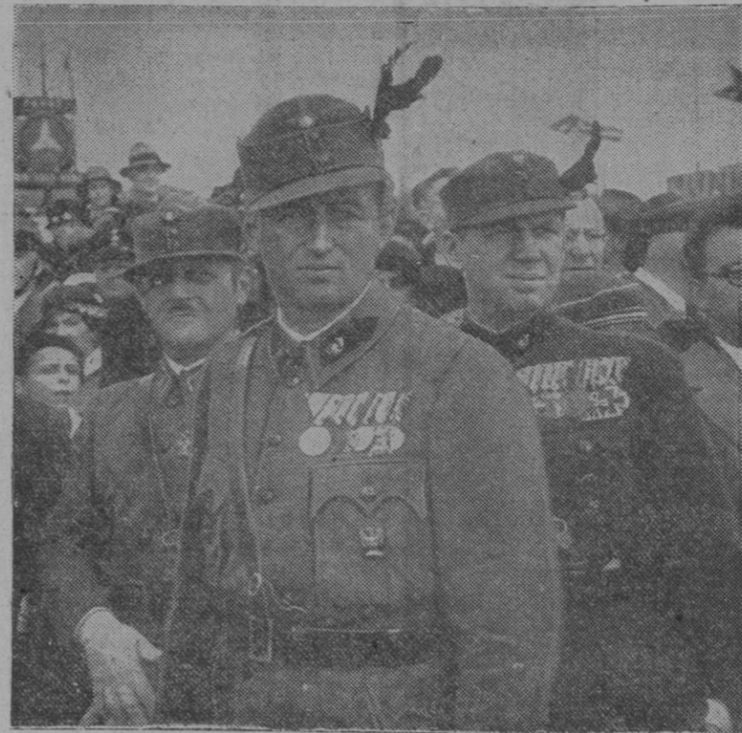
El príncipe Starhemberg, jefe de la Heimwehr austriaca en una parada de las milicias

Habiendo recibido nuevas remesas de camas de metal a nuevos precios, pone a la venta todos los nuevos modelos a precios de verdadera ganga, pues para dar idea de ello baste con saber que hay Camas niqueladas (matrimonio) CON SOMIER, a 30 DUROS Frente a la estatua de Juan Bravo Junto a la zapatería Los Chicos