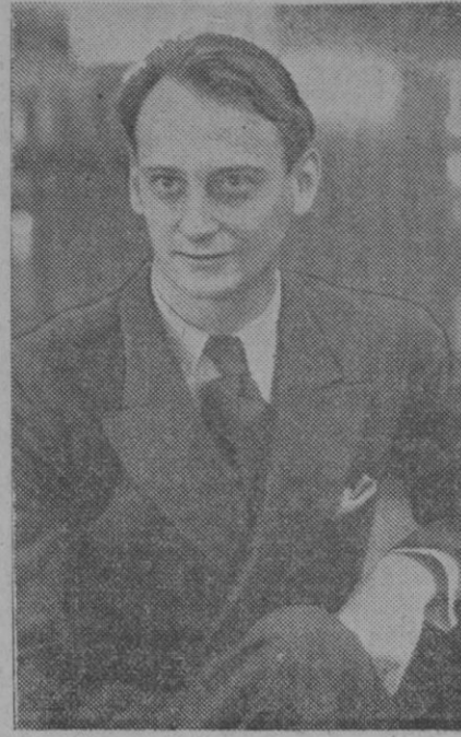
El nieto del ex Kaiser, príncipe Fernando, que durante unos años ha estado empleado en las fábricas Ford, ha adquirido certificado de aviador de servicio regular, y luego ha obtenido un puesto en la gran compañía Pan American Airways

elección de S. E. el Presidente de la República se autoriza al presidente de la gestora para que proceda de apremio contra los Ayuntamientos, entidades y particulares deudores a los fondos provinciales por cualquier motivo o concepto.