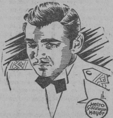
Clark Gable, el famoso galán de la pantalla

Y es muy sencillo. Clark es un hombre de irresistible simpatía, energético, de rápida y feliz comprensión, cuyas respuestas nos atajan veloces en un juego semejante a las partidas de ajedrez, en las que al mover una