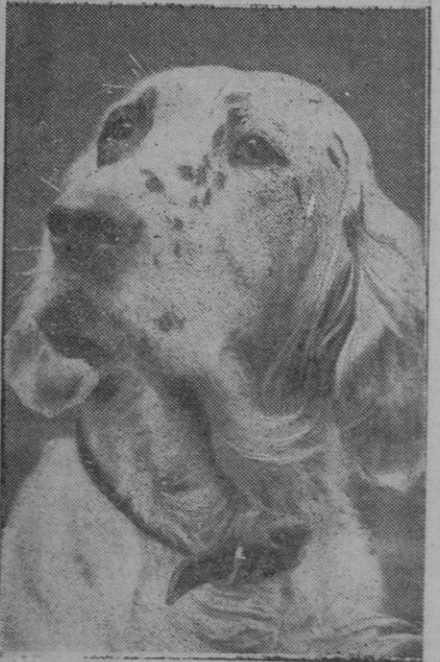
Un sabueso de sangre pura, que ha sido premiado en una Exposición canina verificada en Londres