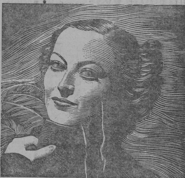
La gran artista Joan Crawford, que recibió de Clark Gable el bofetón que abrió a éste las puertas de la celebridad

En «Susan Lennox», por ejemplo, soportó estoicamente en una escena un verdadero remojón, a pleno aire, durante los meses más crudos del invierno. La propia Greta Garbo, que