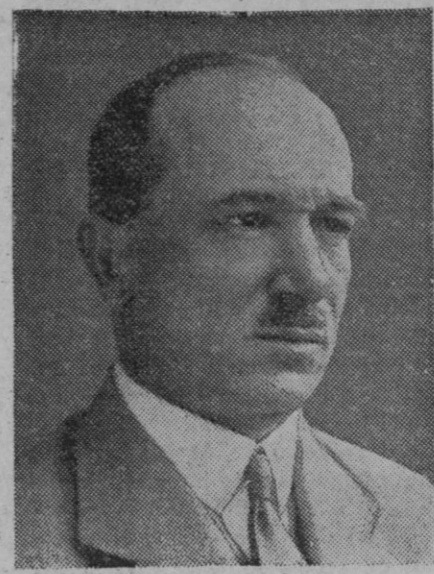
El doctor Benes ministro de Negocios Extranjeros que seguramente sucederá en la presidencia de la República checoslovaca al doctor Masaryk