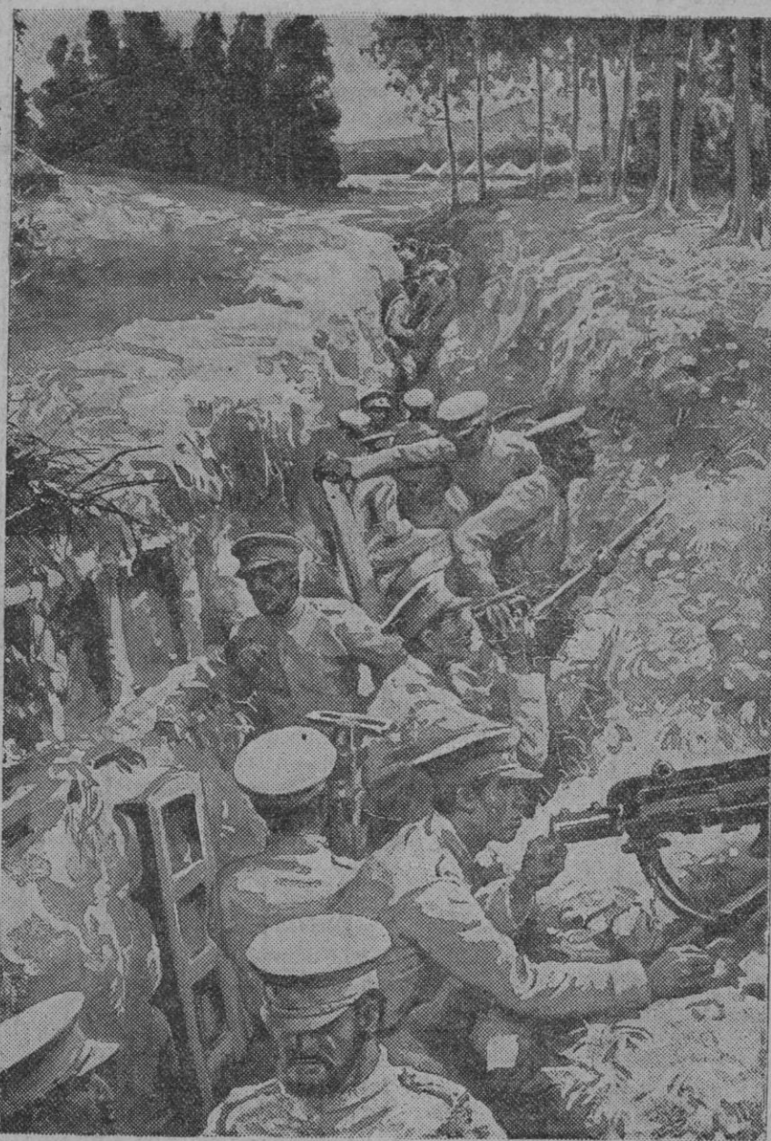
Una trinchera abisinia en el frente sur

Cooperativa de compras de Cantimpalos Cooperativa de fabricantes de Cantimpalos Cantimpalos, 29 (12 m.).—Una cooperativa de fabricantes de Cantimpalos, que incluye a los artesanos de carne de cerdo todos los días laborables, y garantiza el peso.