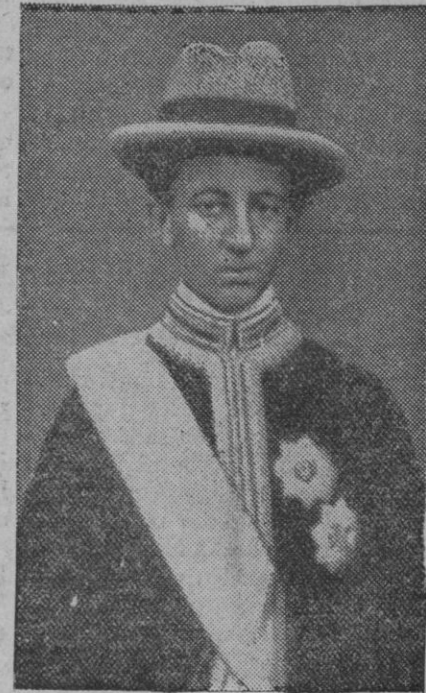
El príncipe heredero, que en ausencia del emperador, asume las funciones de éste

El príncipe heredero asume interinamente las funciones de su padre