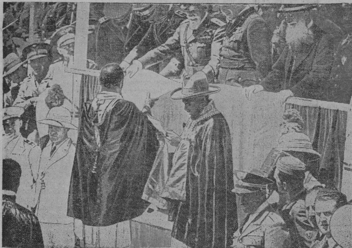
El ras Gugga, yerno del emperador abisinio, que se ha pasado a los italianos, se ve en esta fotografía, en lo alto, haciendo acto de solemne sumisión ante el general Di Bono, comandante en jefe italiano del frente Norte

La Comisión al ministro de Agricultura, desea y espera que pronto se puedan solucionar los problemas que fueron expuestos al señor Martínez de Velasco, el cual seguirá seguidamente prueba de la solución que prepara, publicando el decreto para defensa de los trigueros, teniendo el interés de los préstamos al 4 por 100.