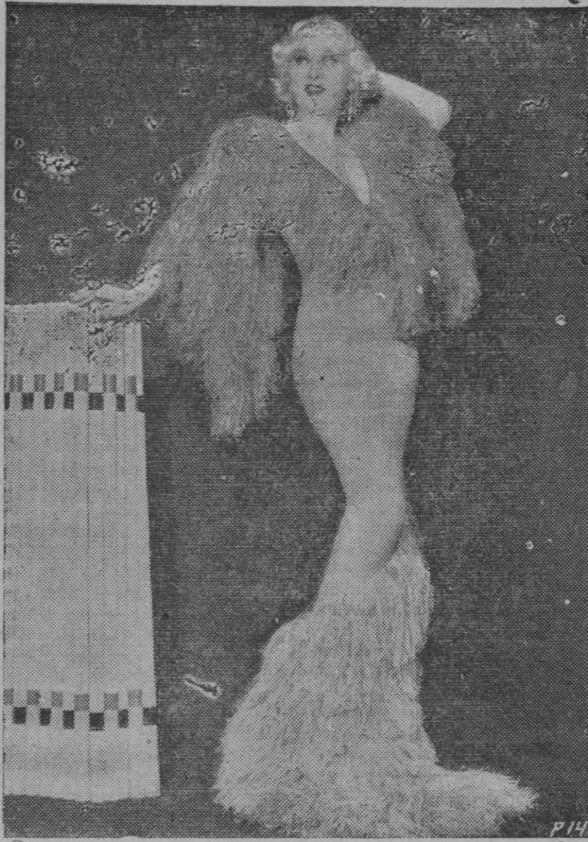
Mae West, que ocupa un puesto preferente por su encanto y sus repetidas triunfales actuaciones en los films

Art. 6.º El conocimiento de las causas por los delitos a que esta ley se refiere, corresponderá a los Tribunales de derecho de la jurisdicción ordinaria, salvo el caso de declaración del estado de guerra, en que se estará a lo dispuesto en la ley de Orden público, siguiéndose en su tramitación