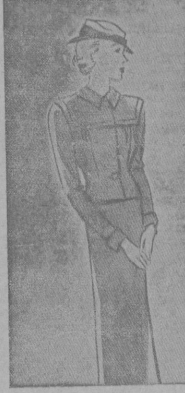
Sencillo completo de mañana en lanilla gris. El sombrero es de fieltro adornado con cinta del mismo color, pero más oscuro momentos de tensión y de descanso el ejercicio.

En organdí de seda estampado, una casa americana ha creado este precioso traje de tarde muy apropiado para fiestas de jardín; se adorna con un ramo de flores que van del escote a la cintura