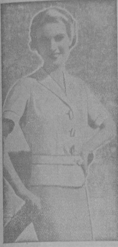
Traje sastré para verano, realizado en hilo grueso blanco. Botones fantasía