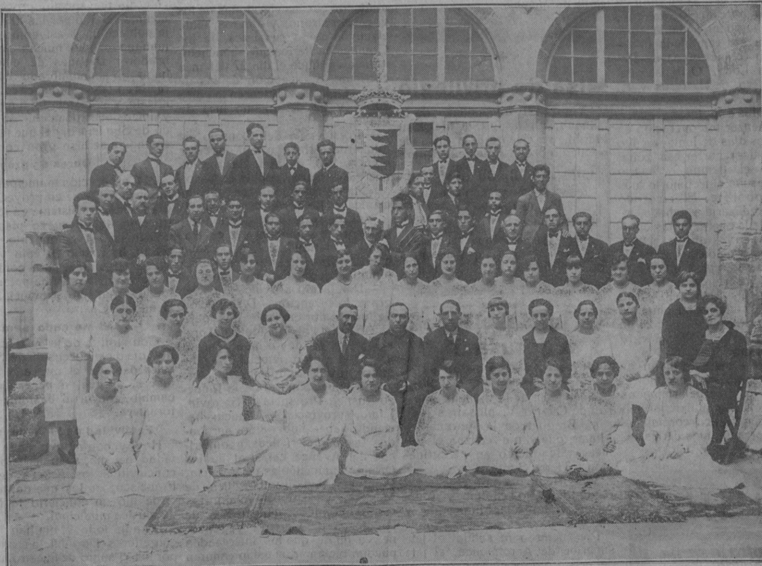
He aquí a la importante agrupación que forma la Coral Vallisoletana, que hoy nos visita, y a la que se dispone a oír el público segoviano, con el entusiasmo y cariño que pone siempre en todas las empresas artísticas, y con el fervor hospitalario que le distingue. Mucho nos complace su visita a esta capital, expresando a los que constituyen esa notable colectividad musical nuestro efusivo saludo de bienvenida.

Provincia de Segovia, la escuela nacional de Beneficencia número 2, en la capital, para maestro y de nueva creación; provincia de Badajoz, nueve para maestro